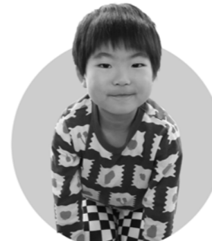
解決ゾロリ こじろうくん