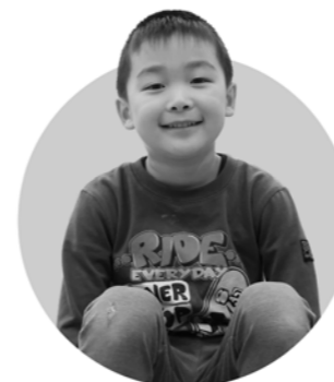
サッカー選手 かえでくん