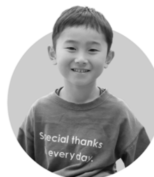
解決ゾロリ こたろうくん