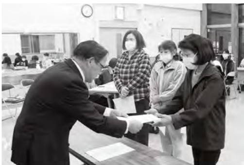
宗田村長から委嘱を受ける保健推進員

際の補助などを行い、地域住民の健康をサポートします。任期は令和8年度から令和9年度までの2年間です。