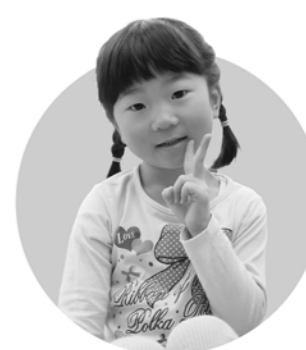
名探偵 みゆちゃん