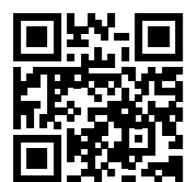
▲母子手帳アプリ「母子モ」