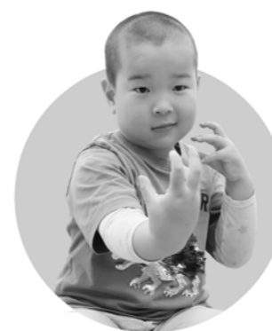
ワンピース もとやすくん