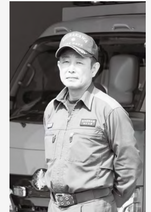
白河地方広域市町村圏消防本部 棚倉消防署鮫川分署長