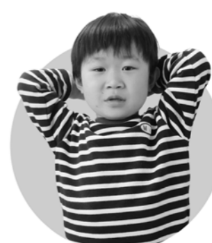
チェンソーマン たいがくん