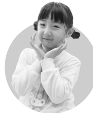
名探偵プリキュア みくりちゃん