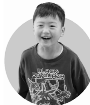
名探偵コナン とうまくん