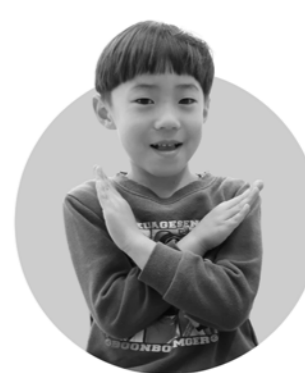
ポケモンを捕まえる たいしくん