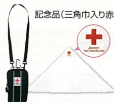
記念品(三角巾入り赤十字ポーチ)