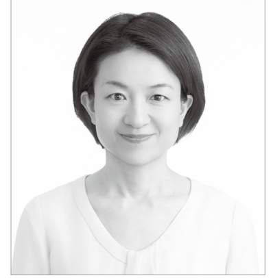
東京農業大学国際食料情報学部 国際農業開発学科 准教授