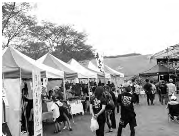
特産品などが並んださめがわ美しいものマルシェ

9月15日(日)に鹿角平観光牧場で、「ドレッドカリパーティー」と「さめがわ美しいものマルシェ」が同時開催され、およそ2,800人の来場者が訪れ、大盛況となりました。来場者には、JA東西しらかわから寄贈されたお米も配布されました。マルシェでは、特産品の大豆加工品や一閑張りのバックや手芸品、屋台ならではのフランクフルトやかき氷などが販売されにぎわいをみせました。FMXのショーでは、ライダーのパフォーマンスに大きな歓声が上がりました。