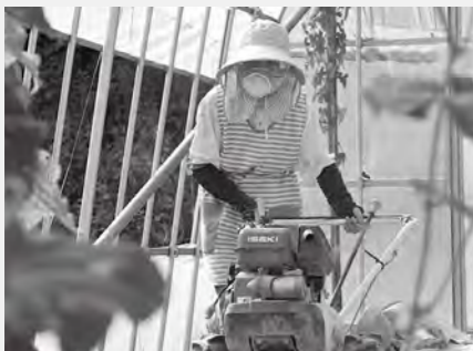
玉ねぎの収穫が終わって次の作付けの準備です