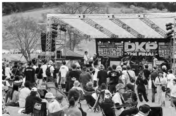
にぎわいをみせた会場