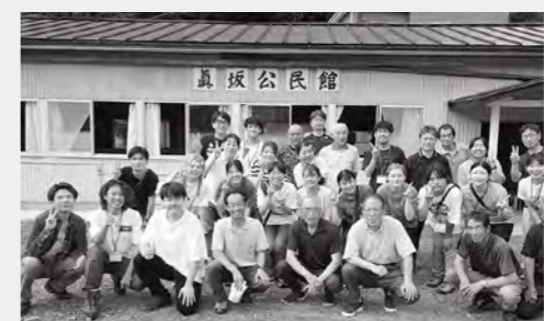
前列左から4番目。真坂集落の皆さん、学生と。

我が国における環境共生の理想郷は、里山にあります。鮫川村の魅力は多くありますが、なかでも、豊かな里山の景観、文化、それを営む村民と学ぶ子どもたちと認識しています。医食同源という考えがあります。美活同源の地域づくりとして美しい村は活力があるという考え方もあります。作る人がいてこそ