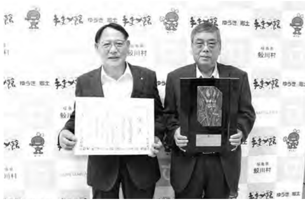
受賞を報告する湯坐社長(右)