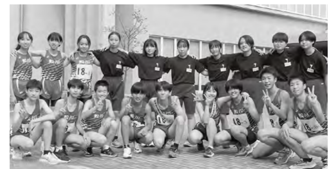
選手のみなさんお疲れ様でした