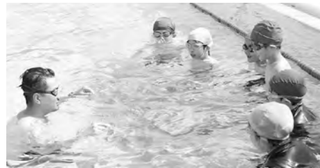
子どもたちに水泳を指導