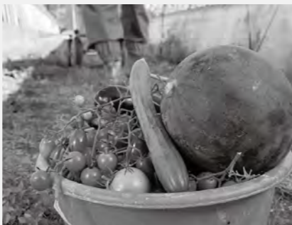
あっという間にカゴは野菜でいっぱいになりました

私は学校生活などで忙しく、ごはんのときにしか祖父と祖母と顔を合わせません。特に話すこともなく、ごはんを食べ終わると、部