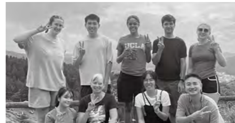
近隣町村のALTとの交流の様子