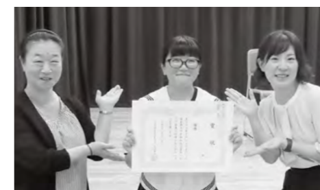
同行した先生方の方が緊張したそうです