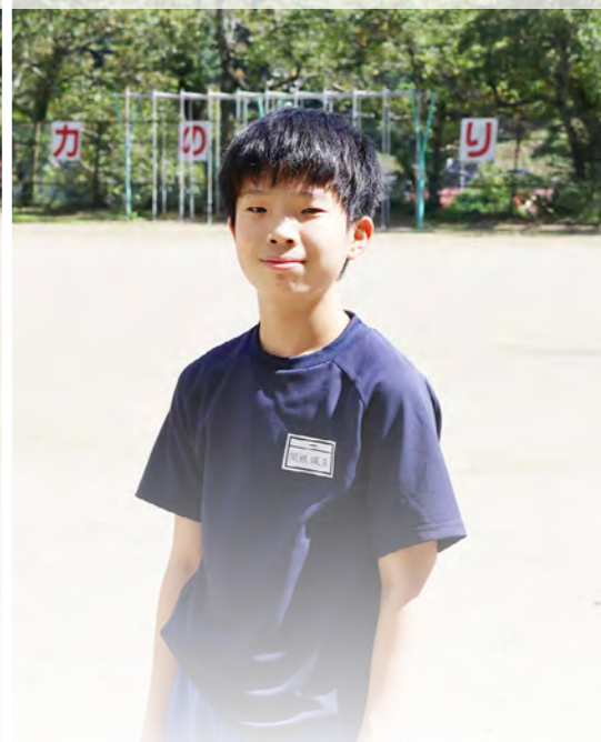
卓球部に入りたい

わたしの今がんばっていることはバレーボールです。理由は、4月から6年生になって試合でコートに入ることが多くなり、ボールが取れなかったときにみんなの足をひっぱってしまったり、コーチに注意されたりするので、コートで活やくできるようにしたいからです。特にレシーブの練習をがんばりたいです。また、下級生のお手本にもなりたいです。