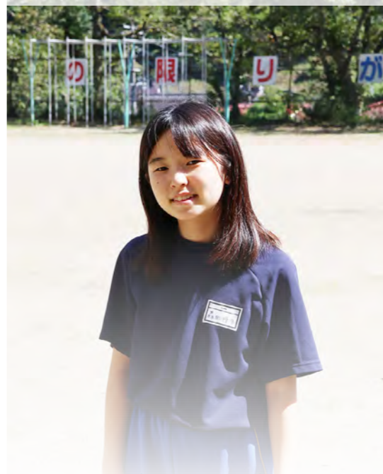
がんばるぞ バレーボール