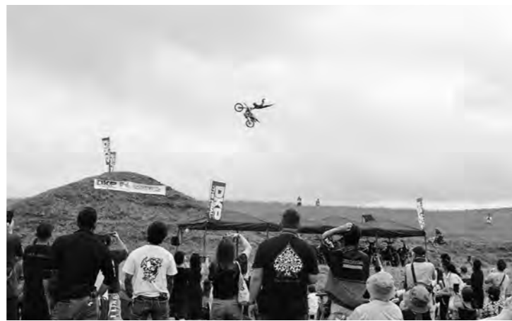
雄大な牧草をバックに飛ばしライダー