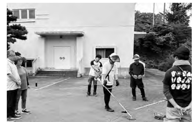
刈払機の取扱いを学ぶ受講者

講習会の受講で刈払機の資格を取得でき、村の草刈りボランティア活動に参加すると受講料が無料になります。草刈りボランティアは、10月20日(日)に行われます。