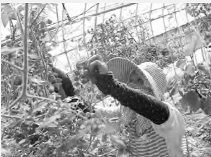
手塩にかけて育てた野菜を手際よく収穫します