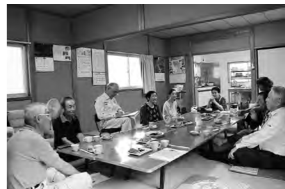
笑い声が絶えない会員の皆さん。 テーブルには持ち寄った漬け物や煮物が並びます。

また、共同で作業をすることで、詳しい人に指導をあたいたり、そういう点も共同で活動する大きなメリットだと話します。