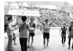
▲昨年イベントの様子