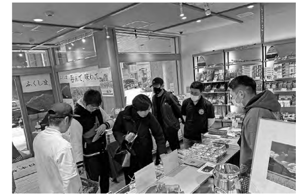
商品を買求める来場者

鮫川村出身の人やさめがわファンクラブの会員など多くの人を訪れ、ふるさとの味を買い求めていました。