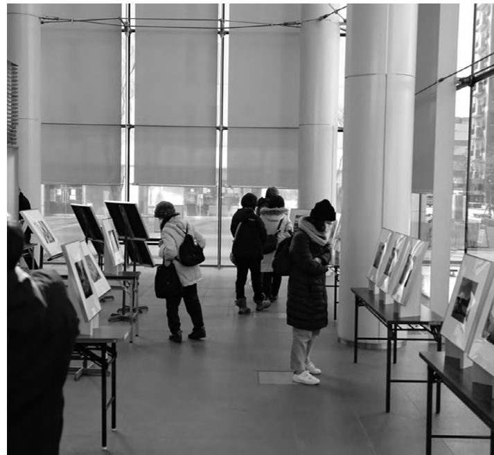
写真に見入る多くの来場者