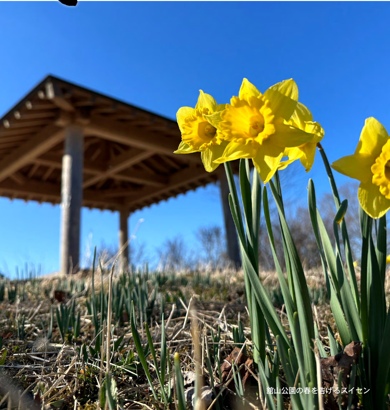
館山公園の春を告げるスイセン

発行/福島県鮫川村 編集/鮫川村役場村づくり推進室 〒963-8401 福島県東白川郡鮫川村大字赤坂中野字新宿 39 番地 5