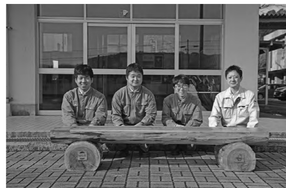
機械科3年生の3名と村農林商工課商工観光係長(写真右端)

2月15日に鹿角平観光牧場・手まめ館・役場内に木製ベンチが設置されました。製作したのは白河実業高校塙校舎で学ぶ機械科の3年生3名です。機械科で学ぶ技術を生かして何かできないかと考え、村役場からベンチ制作の依頼を受け、作成しました。木材は(有)本郷林業から大きな丸太を提供していただき、授業時間を費やして連結や割れた箇所のパテ埋め、やすり掛けなどを行いました。