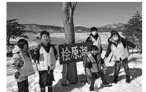
松原湖を背に笑顔の子どもたち

また一般を対象とした雪山トレッキングも同時開催され、12人が参加しゴールを目指しました。