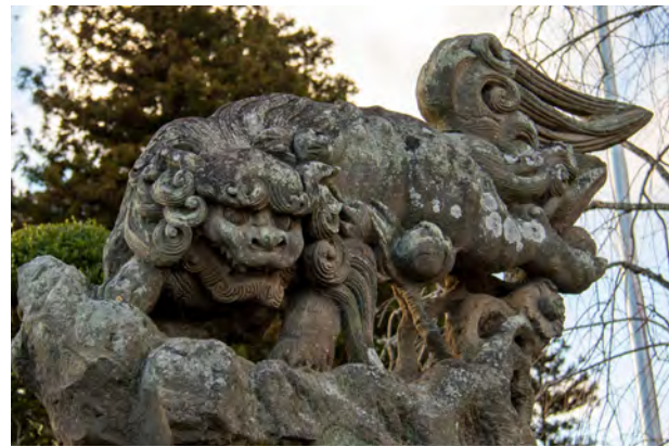
明治25年作。寅吉初の飛翔獅子型の作品で、自ら神社に奉納しました。1つの巨石から掘りだすというスタイルは、当時の常識を覆すほどの画期的な作品として評価されています。