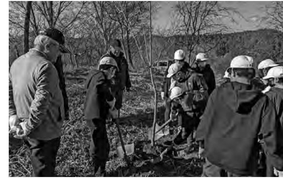
アドバイスを受けながら植樹をする子どもたち