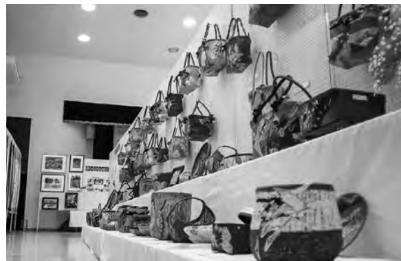
見事な一閑張りが展示されている様子