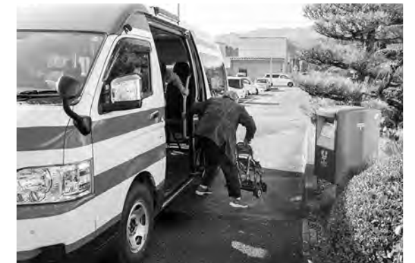
デマンド交通を利用する様子

11月14日に始まったデマンド交通の実証運行から1か月が経ちました。12月14日現在の利用登録者数は105人、日に日に登録者数が増えています。利用者に話を聞くと「家族に気を使うことなく出かけられるので助かります」「電話で予約できるのが良いです」「村内を自由に移動できるのでみんなに広めたいです」とのことです。利用者の声を集め、様々な運行形態を模索している実証運行ですので、まずはみなさんぜひ利用してください。※12月29日～1月3日は運休です。