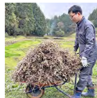
皆さんの素敵な写真を投稿しよう!!

ハッシュタグ 「#さめがわいいところ」 を付けたインスタグラム投稿写真を紹介しま