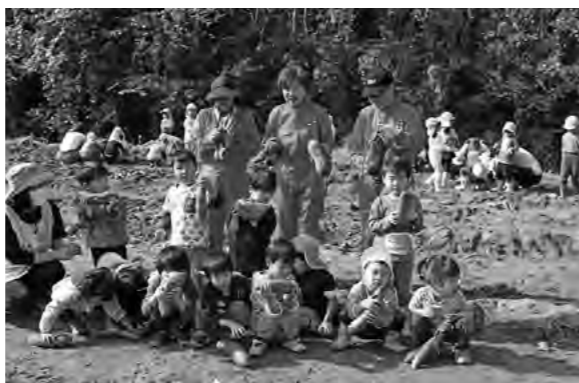
ばばレンジャーと子どもたち

10月27日にこどもセンターで恒例のサツマイモの収穫作業が行われました。ばばレンジャー3名が出勤し、清々しい秋晴れの下で子どもたちと一緒に汗を流しました。ばばレンジャーは「子どもたちと触れ合う時間はとても幸せで、こちらがたくさんパワーをもらえました。子どもたちから「がんばって」と声をかけられたのも嬉しかったです」と笑顔で話してくれました。