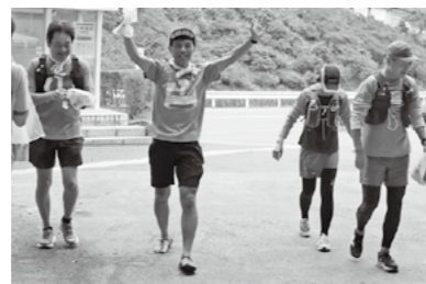
両手を上げてゴールを喜ぶ参加者

去年はチェックポイントが館山に集中していましたが、今回はチェックポイントを強滝や富田薬師堂などにも設置し、参加者が村内を周遊できるように工夫しました。チェックポイントへの移動は歩くか走るの2つしかありません。