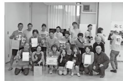
表彰式後に参加者とスタッフで記念撮影

参加者からは「若い人のアイデアが素晴らしい」「イベント全体の雰囲気や和やかで参加して癒された」「次回があるならぜひ参加したい」などの感想が寄せられました。