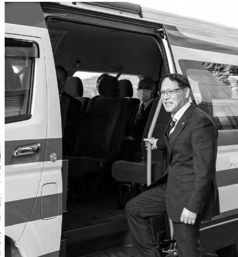
笑顔でデマンド車両に乗り込む村長