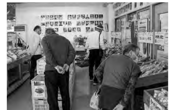
たくさん並んだ野菜を買い求める来場者

11月9日~11日の3日間、18周年を迎えた手まめ館で大感謝祭が開催されました。当日は開店を待つ人で行列ができ、多くの方が感謝祭に訪れました。達者の味噌や、豆腐、油揚げなどの大豆加工品が限定特価で販売されたり、たくさんの野菜が並ぶ店内で、来場者は笑顔で買い物を楽しんでいました。食堂ではバイキングが行われ、子ども連れの家族も訪れ賑わいを見せていました。