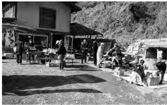
イベント会場の様子