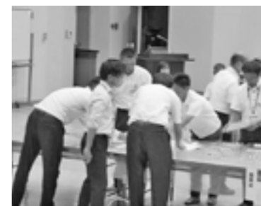
開票作業にあたる村職員