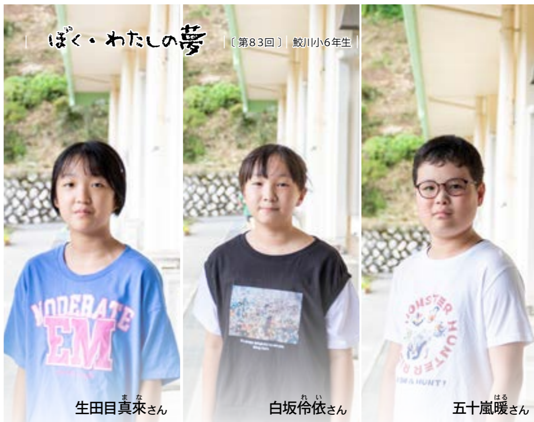
ぼく・わたしの夢 [第83回] 鮫川小6年生

発行/福島県鮫川村 編集/鮫川村役場村づくり推進室 〒963-8401 福島県東白川郡鮫川村大字赤坂中野字新館 39番地5