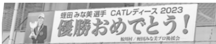
役場に飾られた横断幕

村出身のプロゴルファー蛭田みな美さん(26)が「CAT Ladies 2023」で初優勝を果たしました。大会は8月18日から21日までの3日間で行われました。最終日、首位スタートの蛭田プロは最終ホールで痛恨のボギーとなり、西郷真央プロとのプレーオフにもつれ込みましたが、勝負のバーディーパットを見事に決め、プロ8年目悲願の初優勝を飾りました。本当におめでとございます!