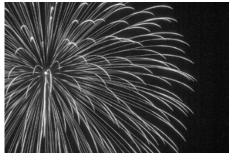
視界いっぱい広がる花火