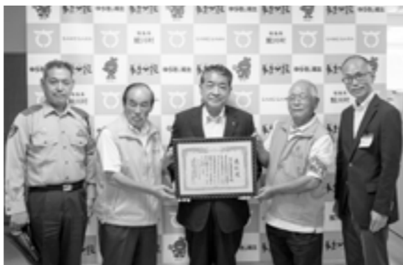
表彰状を手に笑顔の関係者

7月17日で村は交通事故死亡事故ゼロ1000日を達成しました。7月26日には村役場正庁で表彰式が行われ、伊藤智樹県南地方振興局長が福島県知事からの表彰状を村長に伝達しました。村長は「村民一人ひとりが、一つひとつの小さな積み重ねを行った結果です。とても素晴らしい。これから日々を積み重ね2000、3000日と達成できるようにがんばります」と決意を新たにしました。