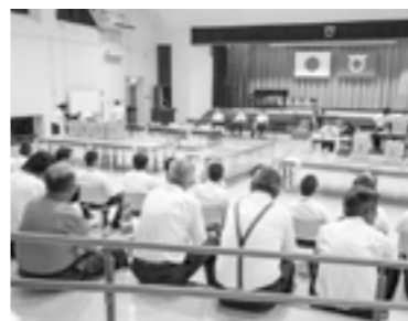
開票を見守る多くの有権者