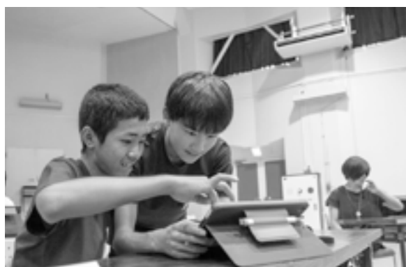
タブレットを操作し笑顔の中学生たち