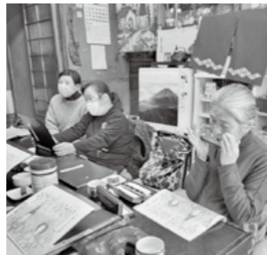
ハーモニカを伴奏に歌う様子

伴奏のおかげで、歌を忘れても 伴奏があるから自然と思い出し て歌えるんだそうです。