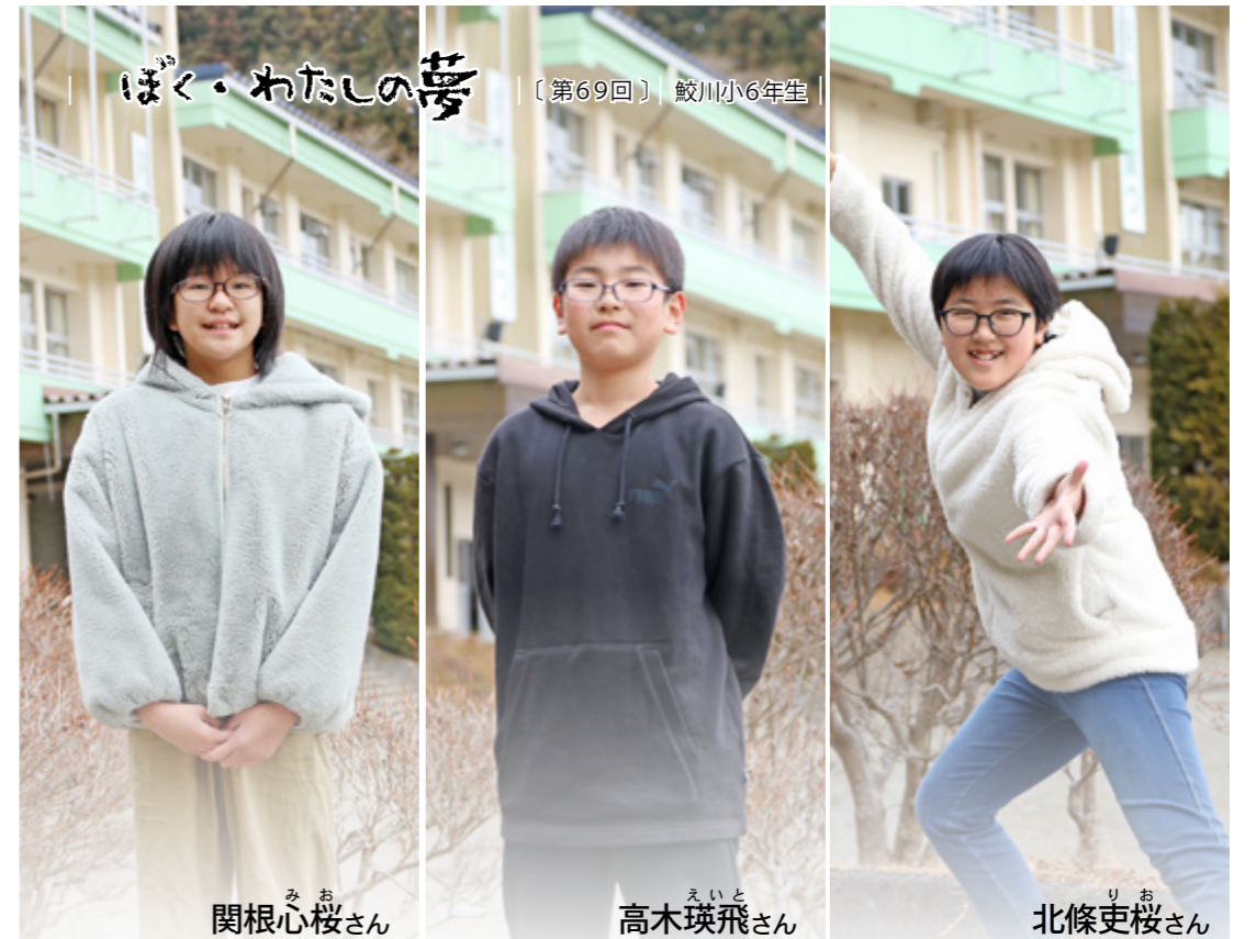
ぼく・わたしの夢 [第69回] 鮫川小6年生