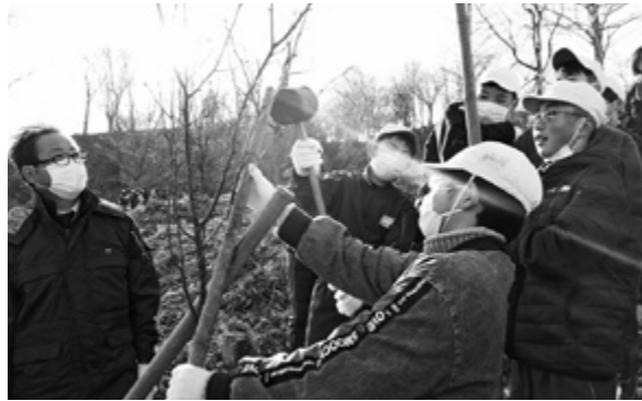
みんなで協力して植樹をする6年生たち