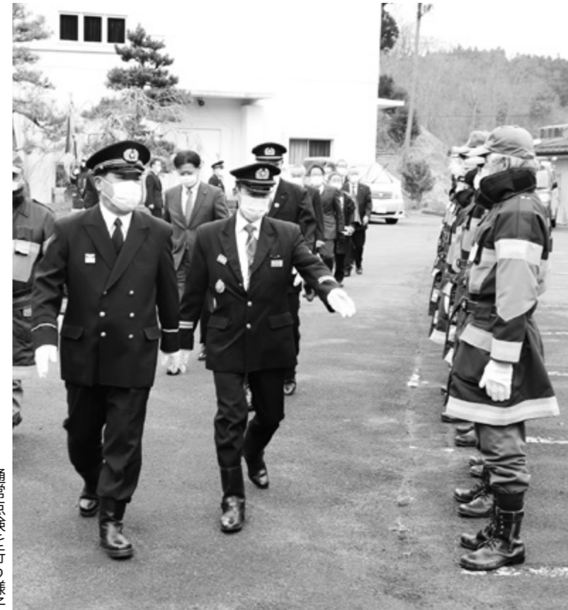
通常点検を行う様子