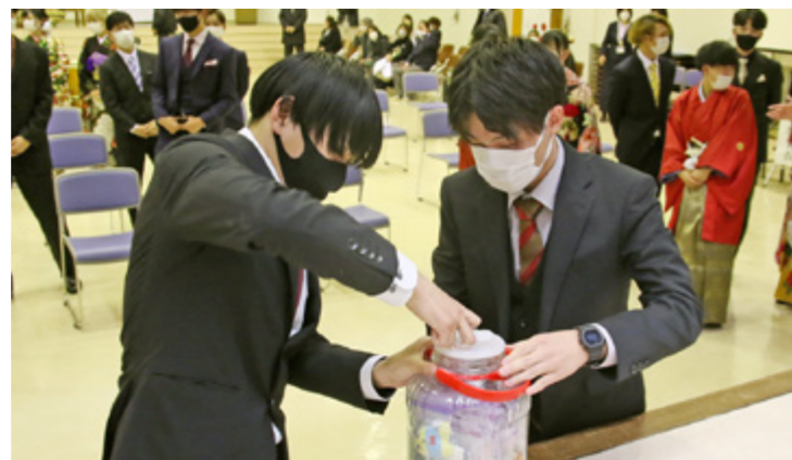
記念式典ではタイムカプセルを開封して大盛り上がりでした