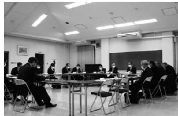
廃校利用検討委員会の様子

第2回鮫川校廃校利用検討委員会が1月13日に役場正庁で開催されました。第1回で出た意見をもとに、委員会から「廃校後の建物の活用はしないこと」との答申書が村に提出されました。村はこれを受け、県に廃校後の校舎の解体を要望します。委員からは「解体後、土地の有効活用については、しっかりと検討して欲しい」など、土地の活用に向けて前向きな意見が多く出されました。