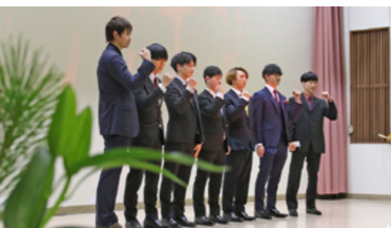
級友との再会に盛り上がりました