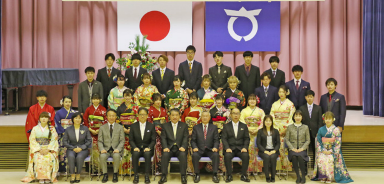
式に参加した28人の新成人、恩師と一緒に記念撮影をしました