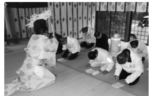
1年の事故防止を祈願する参加者