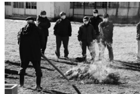
燃え上がる様子を見守る参列者