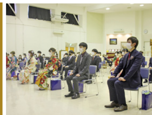
今日から大人としての第一歩を踏み出します