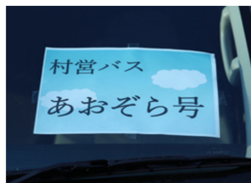
このステッカーが目印です