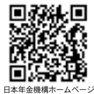
日本年金機構ホームページ