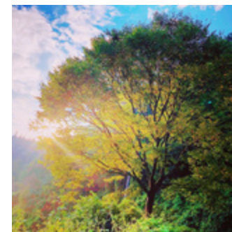
皆さんの素敵な写真を投稿しよう!!

ハッシュタグ 「#さめがわいいとこ」 を付けたインスタグラム投稿写真を 紹介します