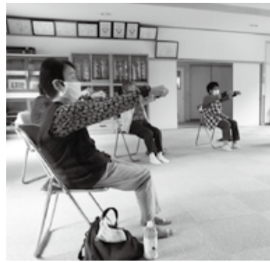
手に重りを付けて少し負荷をかけます

「いやいや、つかれっちゃう」と体操中に誰かが思わず言う。「がんばりな! もう少しだよ!」とみんな笑いながら声を掛け合います。