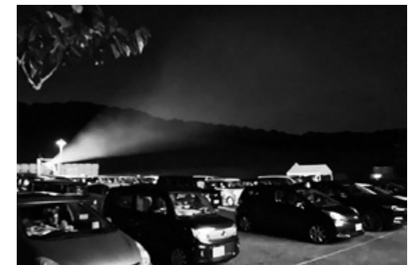
多くの車でにぎわう会場の様子

9月19日に「ほしぞらドライブインシアターin鮫川村」が鹿角平観光牧場特設会場で開催されました。特設されたパルーンスクリーン(12m×7m)に映像が映し出され、音声は車内のカーラジオで聞く仕組みです。赤ちゃん連れの夫婦に話を聞くと「子どもが泣き出しても周りに気を使わなくて済むので助かります。外出を自粛している中、久しぶりに映画館で観る気分を味わえて楽しかったです」と喜びの声が聞けました。