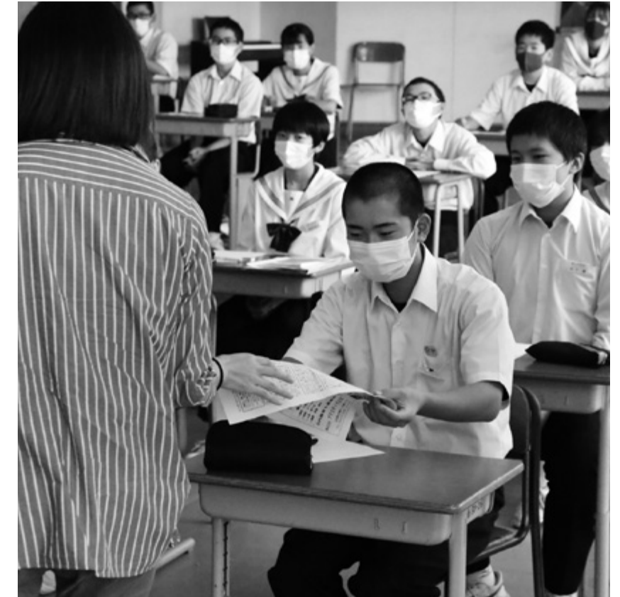
講師と会話を交えながらみんな集中して聞いています