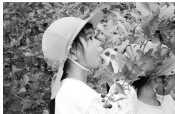
ブルーベリーをほおぼる子どもたち