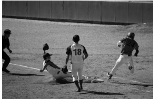
躍動感あるプレーを魅せる選手たち