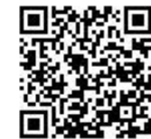
村ホームページQRコード