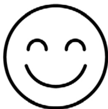
5町村の上空にスマイルマークを描きます

詳しい飛行日程はコチラのQRコードからご確認ください。 一般社団法人東白川青年会議所 Official Weblog