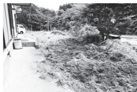
増え続けるイノシシ被害対策のためにも狩猟をできる人が求められています。(写真は赤坂東野集会所・7月12日撮影)