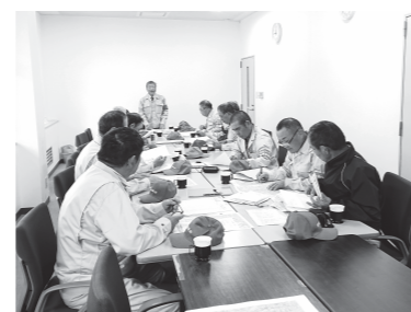
農地パトロール前の打ち合わせ

申し込み[共通] 村農業委員会事務局または村ホームページに掲載されている応募(推薦)用紙に必要事項を記入し、村農業委員会事務局に持参するか郵送してください。