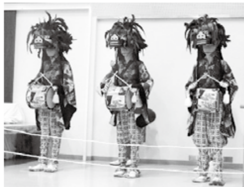
渡瀬の獅子舞の衣装