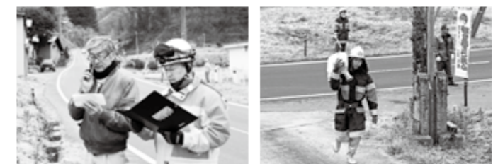
諏訪神社(赤坂西野字中)で昨年行われた火災防御訓練の様子