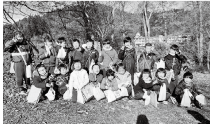
落ち葉の中で、「はいチーズ!」

1年生は生活科「こうえんであきをさがそう」の学習で 館山公園に行き、秋探しの学習を行いました。 文／鮫川小学校