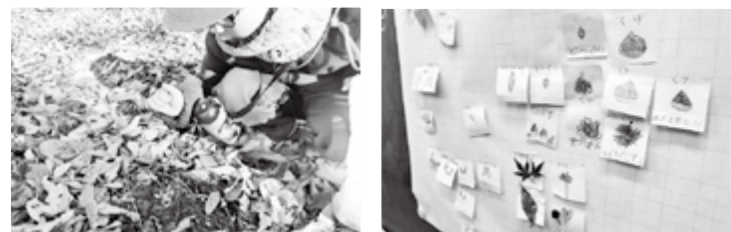
葉っぱをよけてみると何かあるのかな 知っている秋を教え合ったよ

館山公園では、きれいな色の落ち葉を見つけたり、帽子付きのどんぐりを拾ったりでき、自然のあふれる公園の中で、たくさんの秋を見つけることができました。