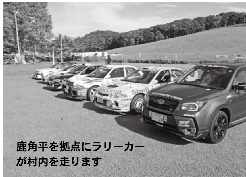
鹿角平を拠点にラリーカーが村内を走ります