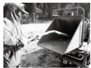
左_さざり荘の薪ボイラー。温泉の加温や室内の暖房に利用しています/右_薪にできない枝はゆうきの郷土でチップに粉碎処理することができます(有料)