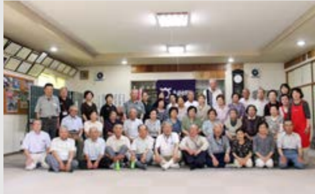
①赤坂中野区元気会、②中野区集落センター、③10月8日(日) ※赤坂中野区民スポーツ大会

村内には、各地域でいろいろな運動コミュニティが活動しています。仲間と一緒に運動することで、楽しく、継続して運動できるようになります。また、姿勢や体の変化を客観的に見てくれる人がいると、運動の効果もより高くなります。地域の人と体の調子などについて情報交換することも大切です。運動習慣を身につけるため、まず一歩を踏み出してみましょう。