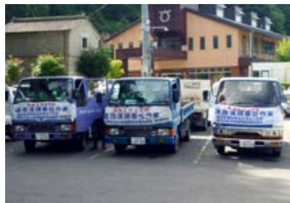
複数台のダンプで一斉に作業が行われました