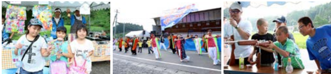
左_食べ物だけでなく、おもちゃやくじ引きの屋台などが出店し、多くの子ども達が集まりました(小童まつり) / 中_よさこいが息の合った演技で会場をわかせました(小童まつり) / 右_射的の屋台では、子ども達が真剣な表情で的を狙う姿が見られました(小童まつり)