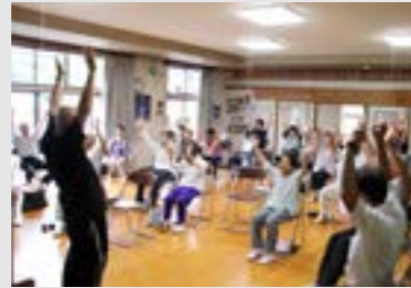
①福寿草の会 ②渡瀬集落センター ③12月3日(日)