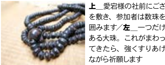
上_愛宕様の社前にごさを敷き、参加者は数珠を囲みます/左_一つだけある大珠。これがまわってきたら、強くすりあげながら祈願します

鮫川の昔話にも登場する愛宕様を奉る水口地域では、毎年数珠回しを行います。今年8月6日に行われ、地域の人など14名が参加しました。数珠回しとは、一周10メートルほどの大きな数珠を囲み、念じながら回していく仏事です。昔は、回しながら唱えるお経もあったそうですが、今では失われてしまいました。それでも地域の残すべき文化として、数珠回しは毎年続けられています。