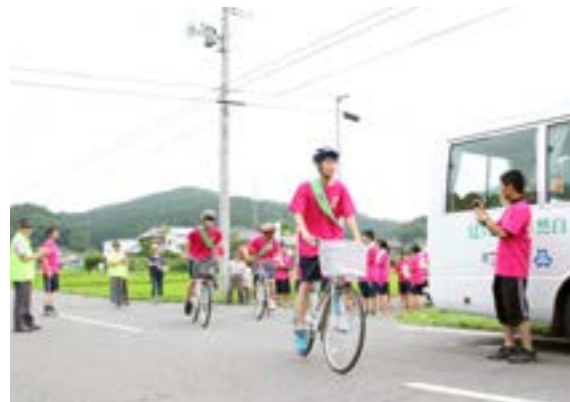
自転車に乗って、高校生の男女がたすきをつなぎます