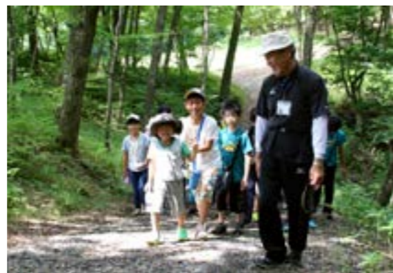
2日目は鹿角平のクロカンコースを散策しました

村公民館主催のチャレンジスクールは8月9日から10日の2日間、村内で行われました。前日までの雨とは裏腹に、2日間好天にも恵まれ、子どもたちは自然遊びを満喫しました。ほっとはうすでテント泊をしたほか、火おこし、まき割り、魚のつかみ取り、流しそうめん、スイカ割りなど、さまざまな体験をしました。子どもたちは疲れを知らず、夏の思い出をつくりました。