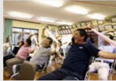
①青生野地区水仙会 ②青生野集落センター ③12月3日(日)