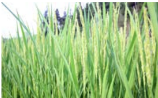
出穂した「里山のつづ」

本誌6月号で紹介しました献穀田の「里山のつづ」がすくすくと育っています。収穫の時期が待ち遠しいです。収穫された「里山のつづ」は、10月下旬に行われる宮中行事「新嘗祭」に献上されます。