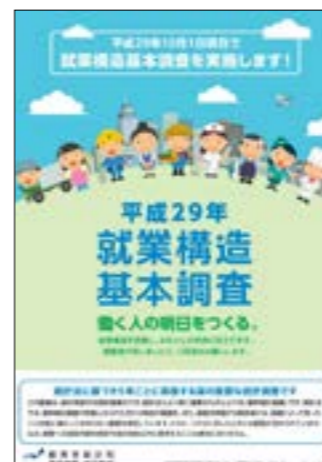
就業構造基本調査は5年に一度行われる国の調査です

就業構造基本調査は、国民の普段の就業・不就業の状態を明らかにし、全国及び地域別の雇用政策、経済政策などの基礎資料とするため、5年に1度、10月1日を基準日として行われます。 今回の調査対象地域は、平成27年国勢調査の調査区のうち総務大臣が指定した調査区で、本村では、大字赤坂西野字滝、仁田、虹ヶ沢、頭割、前折戸、塩倉、前塩倉、荻ノ沢の一部が対象となります。 指定された上記調査区の中から、国が定める方法により15世帯を抽出し、15歳以上の世帯員全員を対象として調査が行われます。