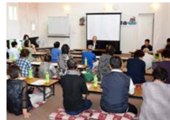
多くの生産者が参加し、栽培方法について学習しました

研修会で提供されたお弁当は、大豆を使ったアイディア料理コンテストで受賞した作品がメニューに加えられるなど、大豆生産から消費するまでを堪能できる研修会となりました。