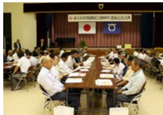
会場には多数の関係者が参列し、喜びを分かち合いました

村税継続完納60年を達成した赤坂東野・石井草区は7月30日に村公民館で「村税継続完納60年達成記念式典」を開き、完納達成を祝うとともに、さらなる継続完納を誓いました。大楽村長、村議会議員、区関係者などが出席。式典では、区長が関係者らに感謝の言葉を述べるとともにこれまでの歴史を振り返り、歴代区長に感謝状を手渡しました。その後、祝宴が開かれ、改めて継続完納60年達成の喜びを分かち合いました。