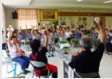
①つくし会 ②赤坂西野区民センター ③10月22日(日)