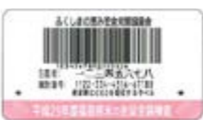
生産者バーコードラベル