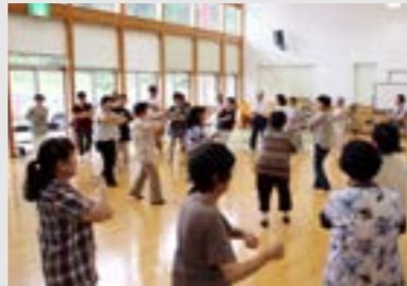
①はつらつの会 ②村保健センター ③10月29日(日)