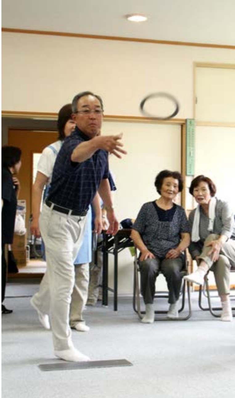
クオリティで賑わいます (富田地域ふれあい教室)

団塊の世代が75歳以上となる2025年、鮫川村の人々の暮らしはどうなっているでしょうか。村の人口推計では、現在の3423人から、8年後の平成37年度には2830人にまで減少し、高齢化率は35・7%から44・5%へ上昇、村民の約2人に1人が高齢者という時代が訪れようとしています。将来、鮫川村で自分らしい生活を送るために、当事者として、家族として、今、私たちに何ができるでしょうか。