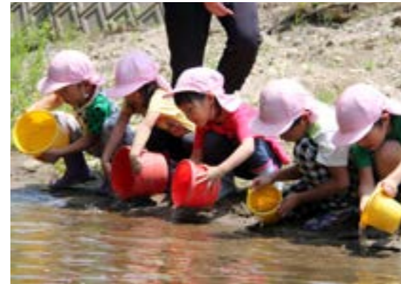
一斉にヤマメの稚魚を放す園児