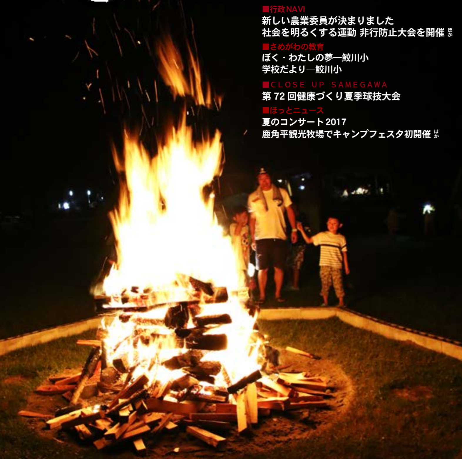
激しく燃え上がるキャンプファイヤー(鹿角平キャンプフェスタ)