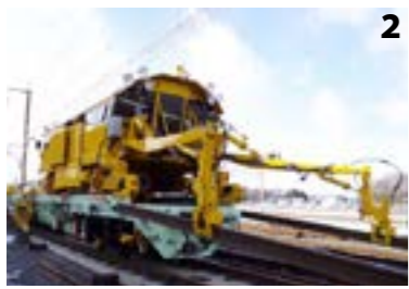
1_新幹線那須基地分岐器新設工事の様子/2_世界で初めてレール交換システム(REXS)を導入し、一度に1500m長のレール交換作業が可能となりました。今春から10年かけて大宮駅~郡山駅間190kmのレール交換をします/3_震災の際はいち早く復旧作業に取り組み、地域復興に多大な貢献をしました