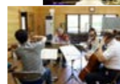
上_来場者を魅了した演奏／左_演奏会前には「ほっとはうす・さめがわ」で合宿が行われました