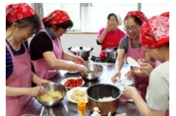
村食生活改善推進員と郷土料理作りを体験をする参加者

北区健康づくり栄養グループ「食彩」の農村体験ホタルツアー2017は6月24日、25日の2日間、村内で行われました。ツアーには北区民18人が参加。1日目は野菜収穫体験を行い、郷土料理でお腹を満たした後、ホタルを観賞し、幻想的な光に酔いしれました。2日目は村の食生活改善推進員とともに、村内産の食材を生かした料理作りを体験し、鮫川の自然と食を満喫しました。