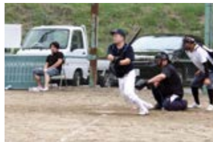
会心のヒットで勝負を決定づけました