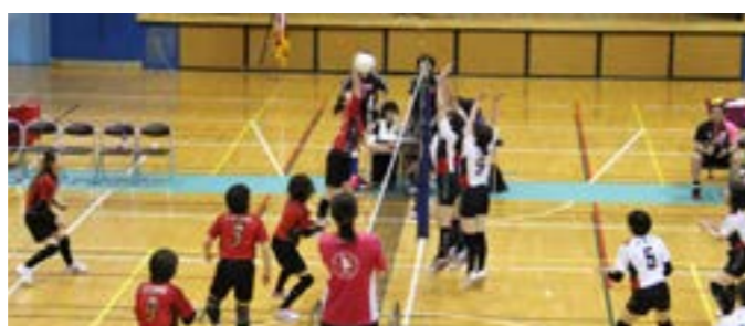
どのチームも譲らぬ好試合が繰り広げられました