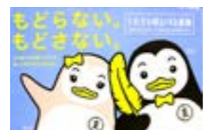
再犯防止を訴える活動ポスター

この大会は、7月を「社会を明るくする運動強化月間」とし、犯罪や非行の防止と、罪を犯した人たちの更生について理解を深めるため、東白川郡と石川郡の9町村の関係者が一堂に会し、開催されるもの