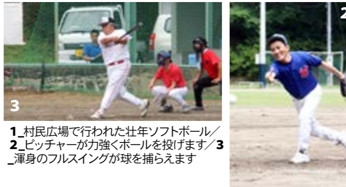
1_村民広場で行われた壮年ソフトボール/ 2_ピッチャーが力強くボールを投げます/3_渾身のフルスイングが球を捕らえます