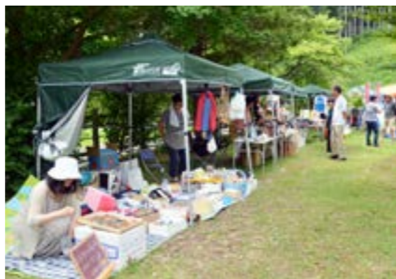
会場にはたくさんの出店が並び、お客さんを迎えました

さめがわdeマルシェ実行委員会は、7月16日にさめがわdeプチマルシェ・フリーマーケットを開催しました。会場となった手まめ館では、手作り雑貨やリサイクル品の販売、ホットドックややきそばなどの出店が並び、子どもから大人まで多くの人で賑わいました。秋には再びマルシェの開催も控えており、若者たちの活気が村を元気づけます。