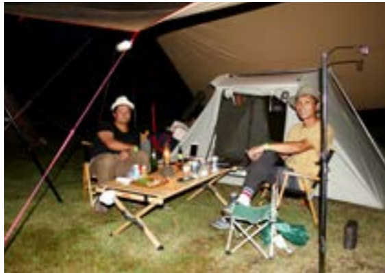
ランプの明りの下でゆったりとした時間を過ごす参加者