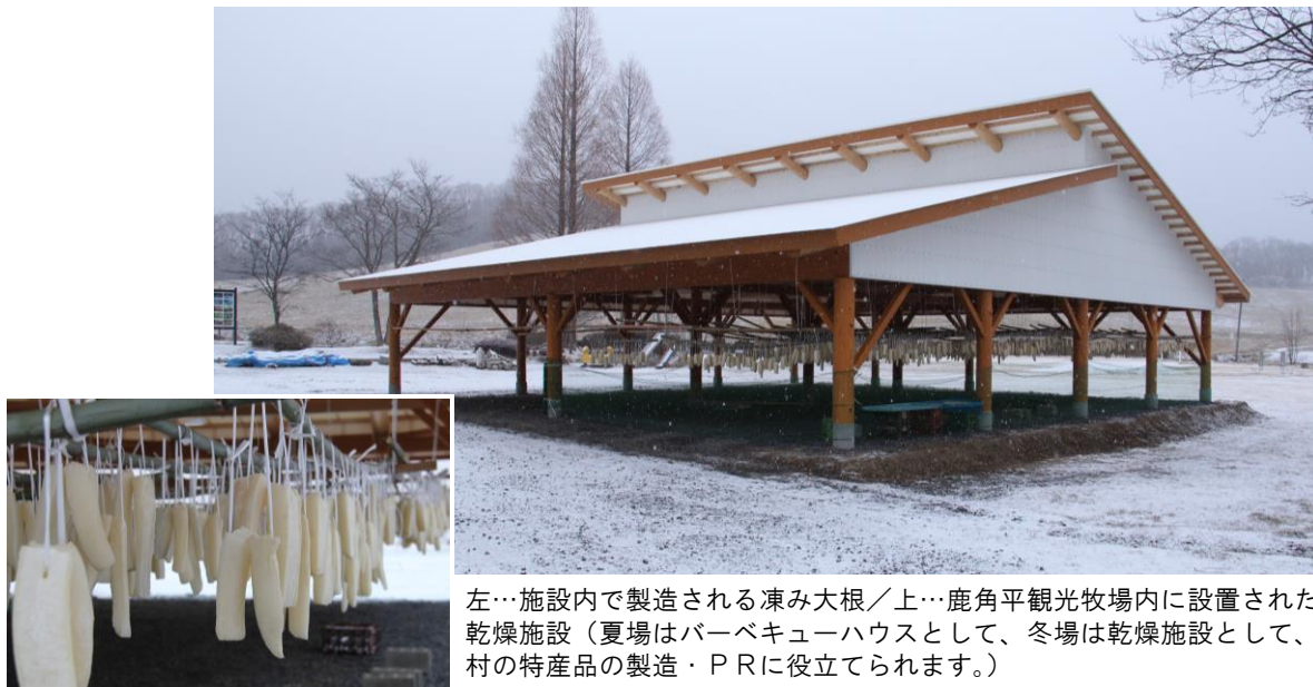
左…施設内で製造される凍み大根／上…鹿角平観光牧場内に設置された乾燥施設（夏場はバーベキューハウスとして、冬場は乾燥施設として、村の特産品の製造・PRに役立てられます。）

また、(有)鹿角平観光センターおよび村商工会から、鹿角平観光牧場内に凍み餅や凍み大根を製造する乾燥施設を整備するための補助金交付(2,000,000円)の要望があったため、ふるさとづくり基金から2,000,000円を取り崩し、補助金の財源として活用しました。