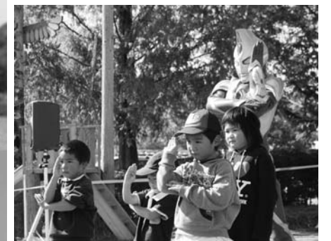
ウルトラマンマックスと記念撮影