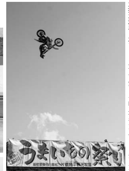
大技が決まったフリースタイルモトクロスデモンストレーション