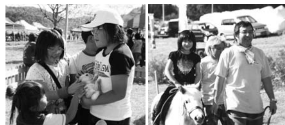
うさぎやポニーとのふれあい