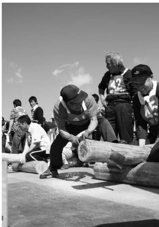
白熱した丸太早切り競争