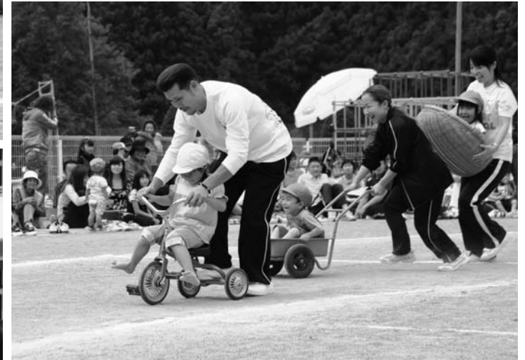
左上/かぼちゃ畑にレッツゴー!! (こすす組) 左中/ちびゴリラとバナナとり (ばら組・親子) 左下/どんぐりひろって トトロにあげよう (すみれ組・親子) 右/カードのうらはなはなに? (あやめ組・親子)

こどもセンターの親子運動会は九月二十六日、同センター園庭で行われました。 競技(演技)では、全員でラジオ体操を行った後、玉入れや紅白リレー、障害物競走などのおなじみの種目のほか、クラスごとに工夫を凝らした種目を次々と披露。子どもたちは、保護者の声援を受けながら元気いっぱい園庭を駆け回っていました。 また、小学生やお年寄りなども競技に参加し、楽しいひとときを過ごしていました。