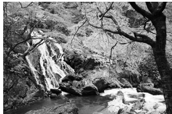
⑦江竜田の滝(そうめんの滝)