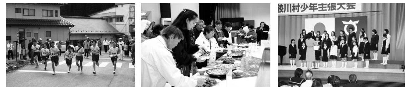
昨年の文化祭行事(左から村民駅伝競走大会、郷土料理を楽しむ会、音楽発表会)