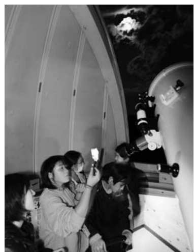
名月を撮影する参加者

中秋の名月の十月三日、鹿角平天文台で月の観察会「名月とつたろう会」が行われました。観察会には家族ら十五人が参加しました。天文愛好会会員の講師に紙製アダプターを製作。同天文台望遠鏡の接眼鏡に携帯電話のカメラレンズを近づけ、月を撮影しました。参加者は、幻想的に浮かび上がった名月をカメラに収め、秋の深まりを感じていました。