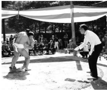
上/大人に負けない好勝負を見せた「ちびっこ相撲」 左/豪快な技が決まるたびに歓声があがりました