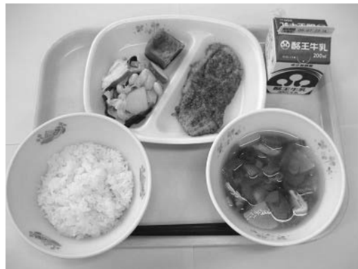
全国学校給食甲子園決勝大会出場を決めた献立

地元の食材を使っておいしことや栄養価などを競う第四回全国学校給食甲子園に、鮫川村学校給食センターが北海道・東北ブロック代表として出場します。 大会には、全国から一五五二の学校給食調理場が参加。書類選考を通過した全国六ブロック代表・計十二チームが大会に挑みます。 決勝大会は十一月八日、東京都駒込の女子栄養大学で行われ、村給食センターチームは地元農産物たっぷりの給食で、日本一を目指します。