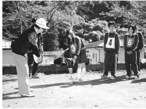
競技を楽しむ参加者

第二十一回老人クラブと修明高校鮫川校生とのふれあいゲートボール大会は十月二十一日、さざり荘ゲートボール場で行われました。老人クラブ会員と鮫川校生が交流を図り、健康づくりと体力の維持向上を目的として実施。老人クラブ会員と鮫川校生八人が参加しました。試合は、混合チームで行われ、参加者は、競技をしながら楽しいひとときを過ごしました。