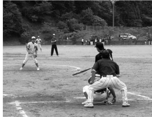
上…9人制バレーボール(農業者トレーニングセンター)／下…ソフトボール青年の部(青少年広場)