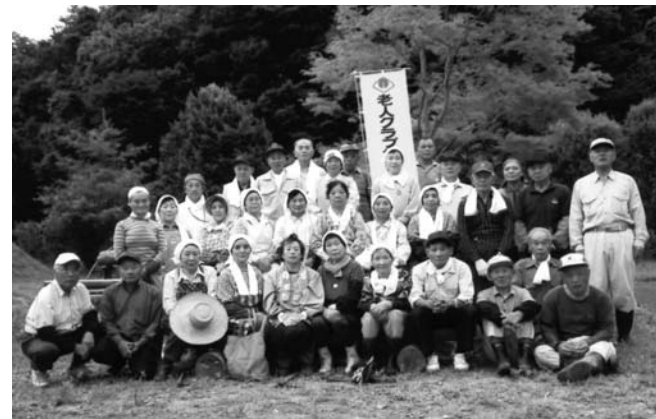
上…西山地区いきいき大学開講式の様子／下…中野地区「元気会」作業後の記念撮影