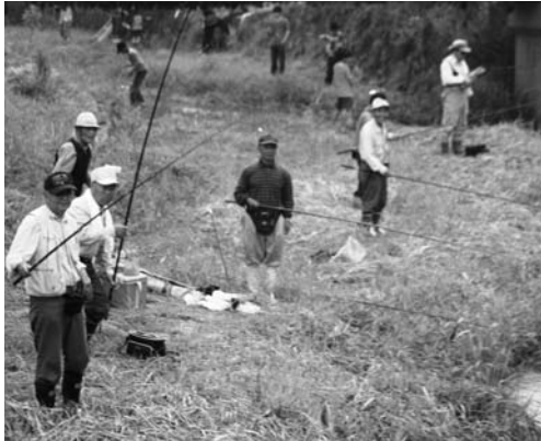
やまめ釣りを楽しむ参加者

渡瀬川やまめ釣り大会は七月十九日、渡瀬地内の村道木之根下線付近で行われました。 イベントを通して地域の活性化につなげようと毎年行われているもので、村内外から約二百人が参加。約一時間の区間に二〇匹から二十五匹ほどのヤマメ約二百二十匹が放流され、大勢の釣り客や家族で賑わいました。 また「こどもエリア」も設けられ、子どもたちは元気いっぱい大物を狙いました。