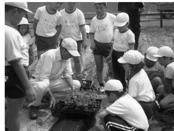
写真...作業を行う児童

現在、青生野小学校では、県の中山間地域連携事業「いのちの学校」の指定を受け、総合的な学習の時間に農作物栽培を進めています。これは農業体験をし、栽培と収穫だけに終わらず、農産物加工・