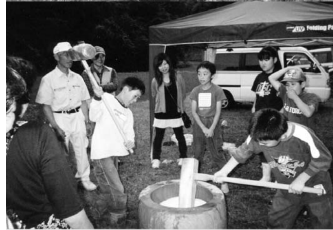
写真上…休耕田の水路を調べる子どもたち／下…餅つき体験などを行った交流会

調べ、ホトケドジョウやサワガニ、カエルなどを次々と見つけました。また、場所を移して今はあまり見られなくなったハッチョウトンボの生息を確認し、鍛木田地区の豊かな自然に触れました。 夜には、交流会が開かれ、水ギョウザ作りや餅つきを体験し、楽しいひとときを過ごしました。