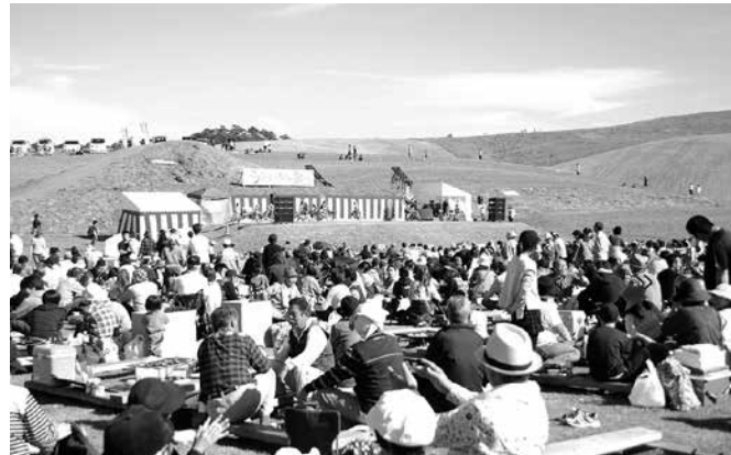
上 塙工業高校和太鼓部による和太鼓演奏が盛大に行われた 下 会場は約2000人の参加者がバーベキューを楽しんだ