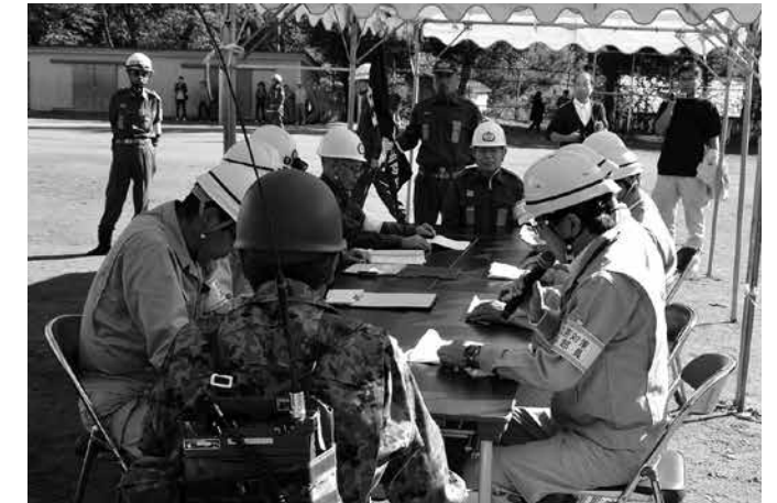
【災害対策本部設置】 鮫川小校庭に災害対策本部を設置。役場の各課長が村内の被害状況を統監(村長)に報告した

平成28年度県南地方総合防災訓練は9月25日、村内6会場で繰り広げられました。村消防団員をはじめ、県南地方8市町村などから、37機関・団体、総勢700人が参加し、災害時の迅速な対応について確認し合うとともに、防災への意識を新たにしました。参加者らは本番さながらの緊張感で訓練に臨んでいました。