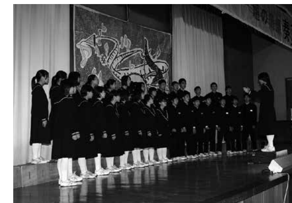
中学校生活最後の壇の岡祭となる三年生の合唱