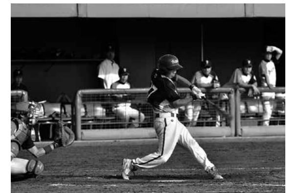
白熱した試合の鮫川対棚倉

県市町村対抗軟式野球大会に出場した鮫川村チームは9月24日、1回戦で昭和村と対戦しました。延長の末、8対7でサヨナラ勝ちをおさめました。2回戦は会津坂下町と対戦し、7対4で勝利しました。続く3回戦は昨年度準優勝の棚倉町と対戦し、1点を争う投手戦へ。1点リードされ、得点圏ヘランナーを進めるものの、あと1本が出ず1対2で惜しくも敗れました。チーム一丸となったプレーに拍手が送られました。