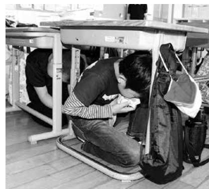
【シェイクアウト・避難訓練】 地震の揺れから身を守る初期行動をとり、校舎外へ全校生徒避難を行った