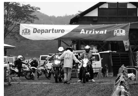
102台のバイクが2台ずつスタートを切った