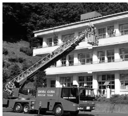
【はしご車による要救助者救出訓練】 鮫川小から出火、消防団が消火活動にあたる中、逃げ遅れた要救助者をはしご車で救出した