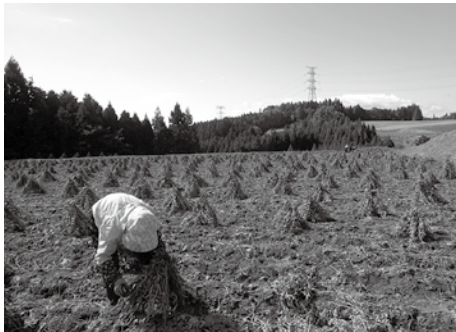
上_ 落合地区でじゅうねんの実の収穫作業を手伝いました。すべて手作業だったため腕が痛くなりました