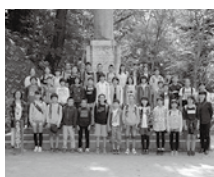
(文・写真)鮫川小学校

10月7日、6年生の修学旅行と1年生から5年生の見学学習を行いました。行き先は、1・2年生はムシテックワールド、3・4年生は郡山市ふれあい科学館と大安場史跡公園、5年生はアクアマリンふくしまと日産自動車いわき工場です。6年生は青生野小と合同の修学旅行で、飯盛山などを見学しました。どの学年も楽しく充実した活動を行うことができました。