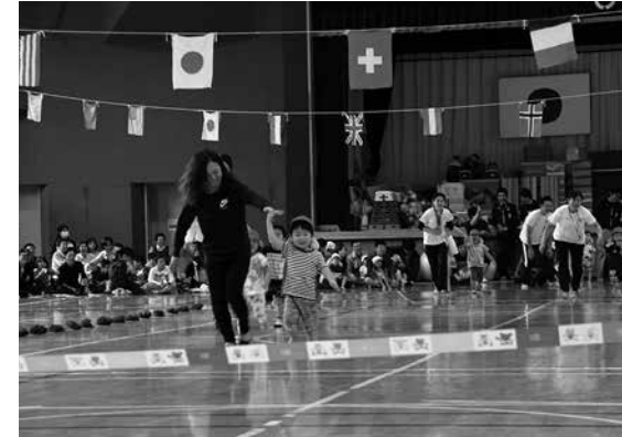
手をつなぎゴールを目指した「大地をけてよーいどん!」