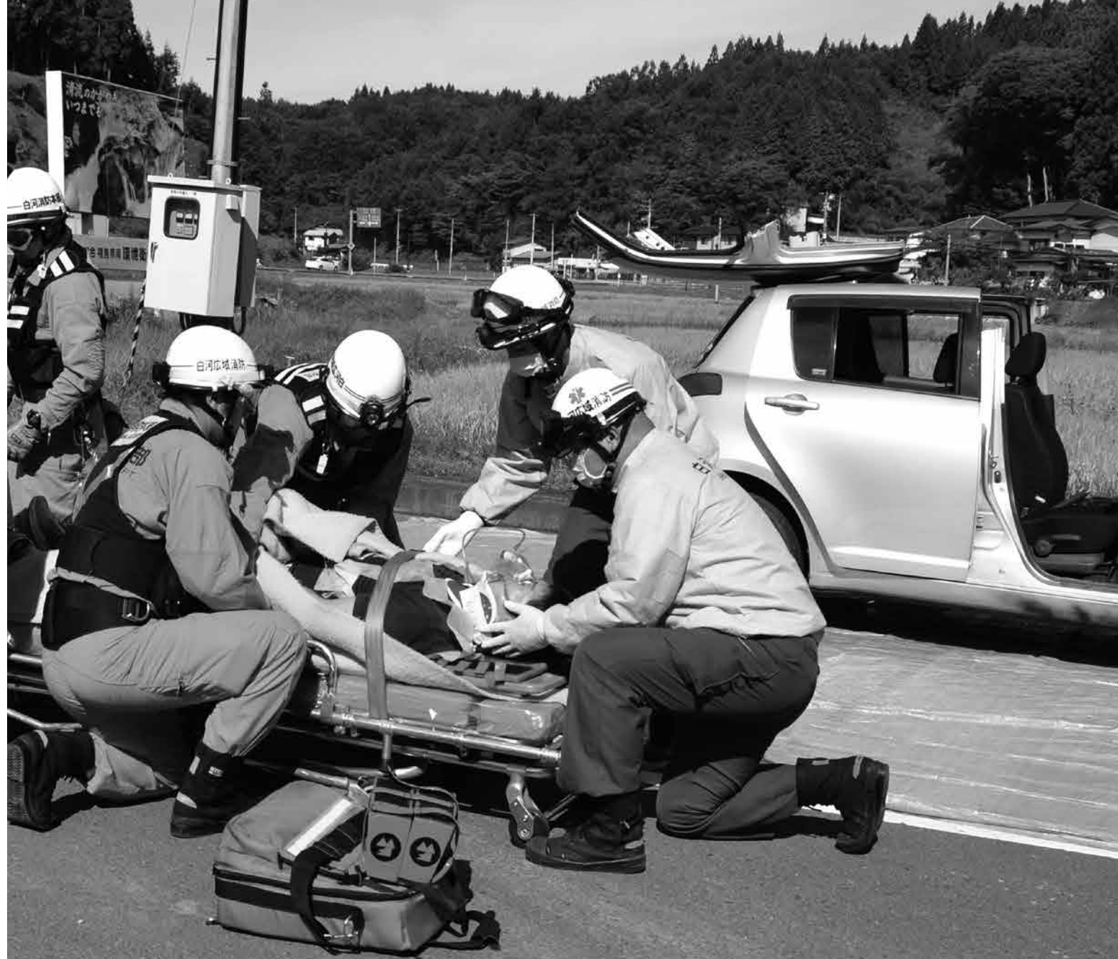
【交通事故救急救助訓練】 交通事故が発生し、車内に残された負傷者を救助隊が救出し、救急車で搬送した

ンター、青少年広場などを会場に、学校避難訓練、はしご車による要救助者救出訓練、障害物撤去および車両排除訓練、炊き出し訓練、防災ヘリコプターの放水訓練などが約3時間半にわたり繰り広げられました。 訓練会場には大勢の見物人が訪れ、訓練の様子を真剣な表情で見守っていました。