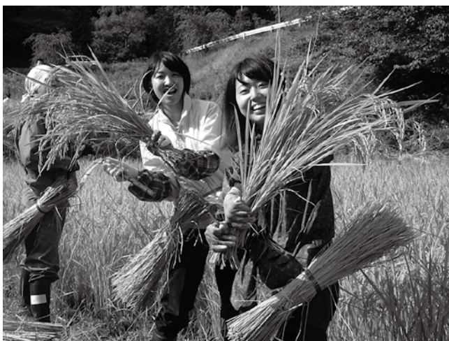
東京農大の保全活動で稲刈りをしました。広島に友達にも手伝ってもらいました

た稲が刈られた景色を見ると少し寂しくなりました。しかし、生きるために食べ、食べるために作っているのです。そんなことは言っていられないですね。丹精込めて作られた新米は、甘みがあつてとてもおいしかったです！ また、10月はお祭りやイベントもあり、たくさんの人と出会い、楽しい時間を過ごせました。残りの任期が少なくなってきたり、景色を見たり、村の人と話したりするとき、ふと切なくなります。