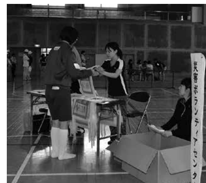
【ボランティア受付訓練、救援物資受け渡し訓練】 農業者トレーニングセンターに災害ボランティアセンターを設置。ボランティアの受け付け、救援物資の受け渡しを行った

平成28年度県南地方総合防災訓練は9月25日、村内6会場で繰り広げられました。村消防団員をはじめ、県南地方8市町村などから、37機関・団体、総勢700人が参加し、災害時の迅速な対応について確認し合うとともに、防災への意識を新たにしました。参加者らは本番さながらの緊張感で訓練に臨んでいました。