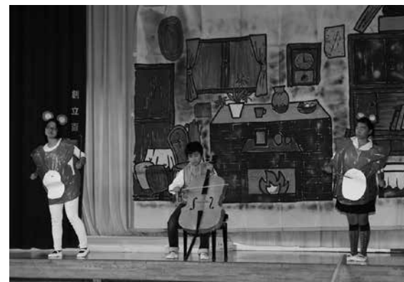
5・6年生による劇「セロ弾きのゴーシュ」

青生野小(藤田篤校長、11人)の学習発表会は10月23日、同校で開かれ、児童たちが日ごろの学習の成果を披露しました。1・2年生による元気な「開幕の言葉」でスタートし、創作劇や主張発表、全校合唱などが披露されました。5・6年生の劇「セロ弾きのゴーシュ」では、堂々とした演技を披露しました。プログラムの最後には、児童、保護者、地域住民などが「村民の歌」を合唱し、体育館いっぱい歌声を響かせました。