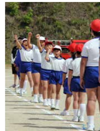
力のこもった「紅白あいさつ」(青生野小)