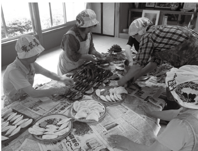
初めて柏餅作りを体験しました。手作りの柏餅はとてもおいしかったです

さらに、柏餅作りをしながら、昔は旧節句の前日に一日かけて家族全員でたくさん作って食べるという習慣があったことを聞きました。昔の暮らしぶりを教えてくれる人がたくさんいることは財産です。鮫川村の暮らしの先輩方、もっといろいろなことを教えてください！