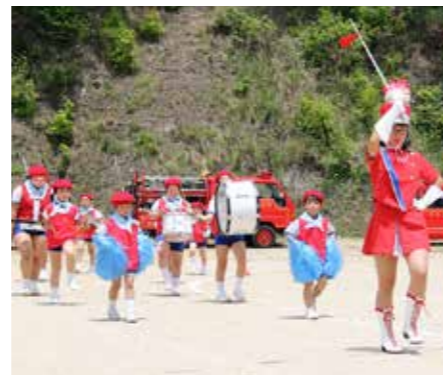
見事な鼓笛パレード(青生野小)