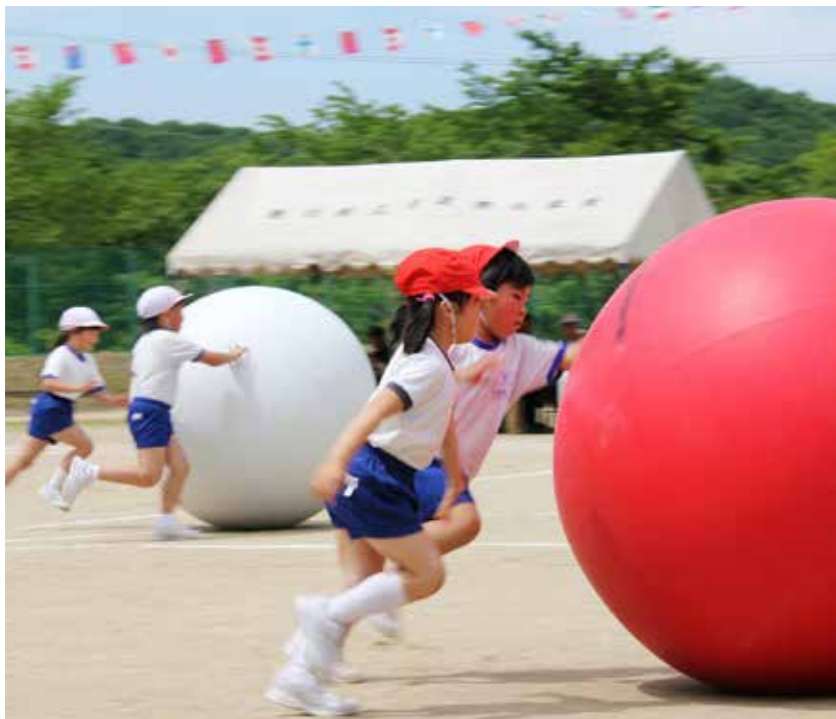
力を合わせて次へバトンタッチ! 「全校紅白大玉ころがし」(青生野小)