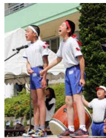
気迫あふれる応援合戦(鮫川小)