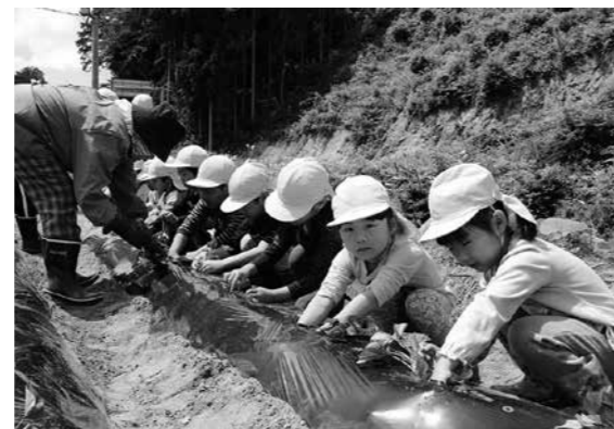
真剣に苗を植える園児たち

サツマイモ以外にナス、スイカや二十日大根を植えました。最後には手慣れた手つきで植える園児もいました。その後、ペットボトルに入れて持参した水をゆっくりと注ぎ、大きく育て収穫できることを楽しみにしていました。