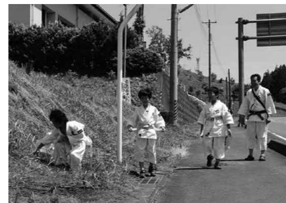
農業者トレーニングセンター沿道のゴミ拾いをする拳士