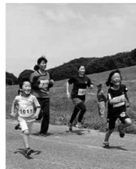
上_勢よくスタートするランナー 下_笑顔で走る親子ランナー