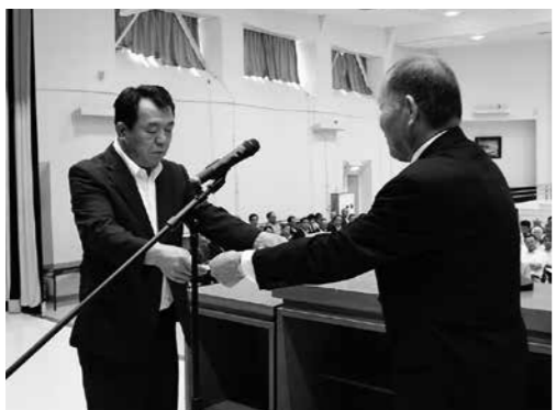
納税完納の表彰を受ける行政区長

村税60年継続完納達成行政区表彰 赤坂西野区、赤坂中野区、青生野区 完納行政区表彰 西山区（64年継続）赤坂東野・石井草区（59年継続）富田区（61年継続）渡瀬区（61年継続） 納期前完納組合表彰（平成27年4月24日までに概算前納した組合） 切払東ほか8組合 納期内完納組合（平成27年内に完納した組合） 酒垂旧ほ