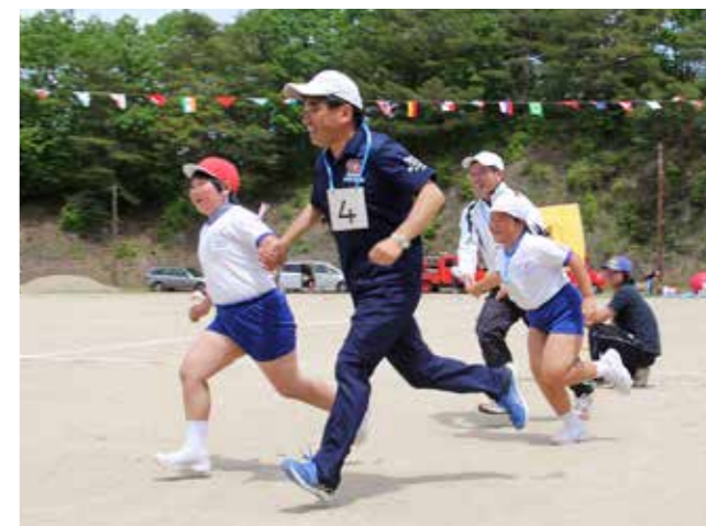
先生とゴールを目指せ! 「せんせいといっしょ」(青生野小)