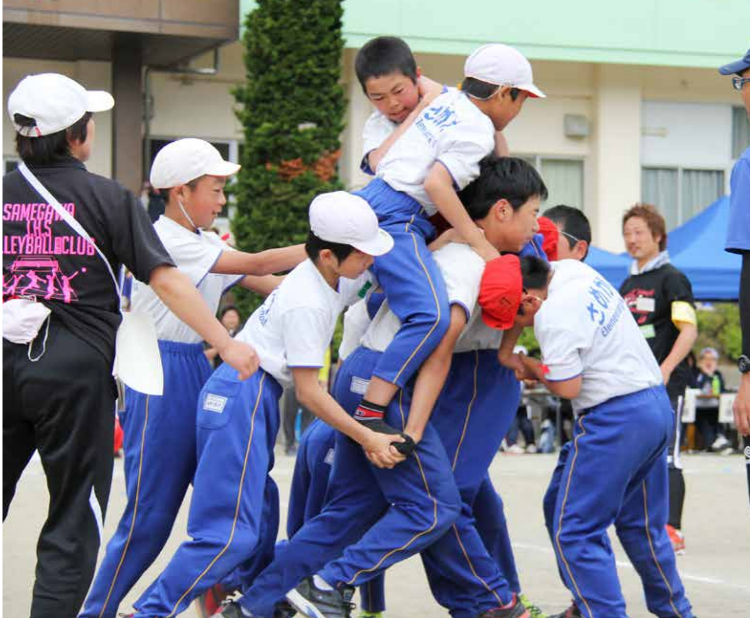
勢いよくスタートする鮫川小5年生