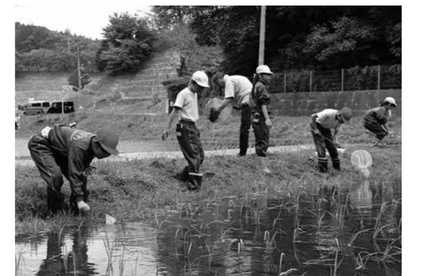
田んぼの生き物を探す児童

児童たちが見つけた生き物の中には、環境省が絶滅危惧類に指定しているホトケドジョウの姿もあり、鮫川村の自然の豊かさを実感できる機会となりました。