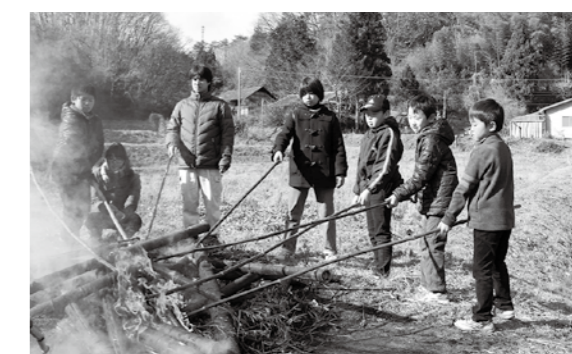
残り火で餅を焼く子どもたち

正月飾りなどを焼き無病息災や家内安全を願う小正月行事が1月、村内3カ所で行われました。真坂地区は10日に「とり小屋」が、富田地区は14日、落合地区は17日に「どんと焼き」が行われました。落合地区では、残り火で焼いた餅を食べて1年間の健康を願いました。