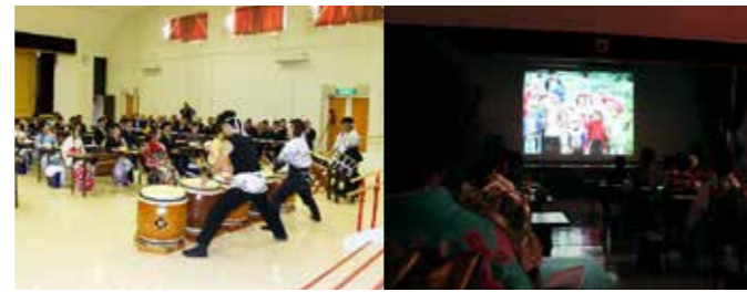
右 懐かしい写真が次々と映し出されたスライドショー 左 二十歳の門出を祝う太鼓演奏