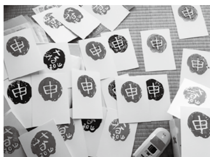
上 藤つるとマツの葉などで正月飾りを作り、玄関に飾りました/下 イモを彫ってはんこを作りました。これでオリジナルの年賀状が完成しました