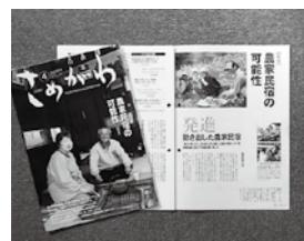
入選した広報さめがわ

「第61回福島県市町村広報コンクール(県、県広報協会主催)」で、「広報さめがわ」が広報紙(町村の部)で2位にあたる入選となりました。また、一枚写真の部では佳作に選ばれました。