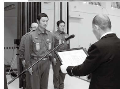
上 通常点検を受ける幹部団員／下 無火災分団と優良団員に賞状が贈られた