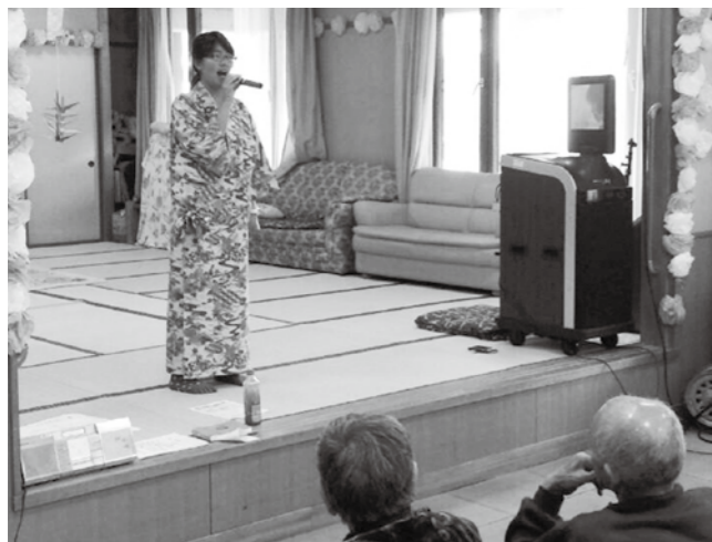
「ひだまり荘」のクリスマス会 で民謡や歌謡曲を披露しまし ました。利用者の皆さんが手拍 子をして喜んでくれました

大晦日は、欲張って富田区の八幡 神社、赤坂西野区の熊野神社、赤坂 中野区の八幡神社に行きました。そ の中で、富田区の八幡神社では和太 鼓を叩かせてもらいました。大晦日 は除夜の鐘だと思っていたので、和 太鼓を叩くことにびっくりしまし ました。鮫川村のお正月をたくさん満喫 しました。せっかく鮫川村に来たの だから、お正月を満喫しようと帰ら ずに過ごして正解でした。最初は家