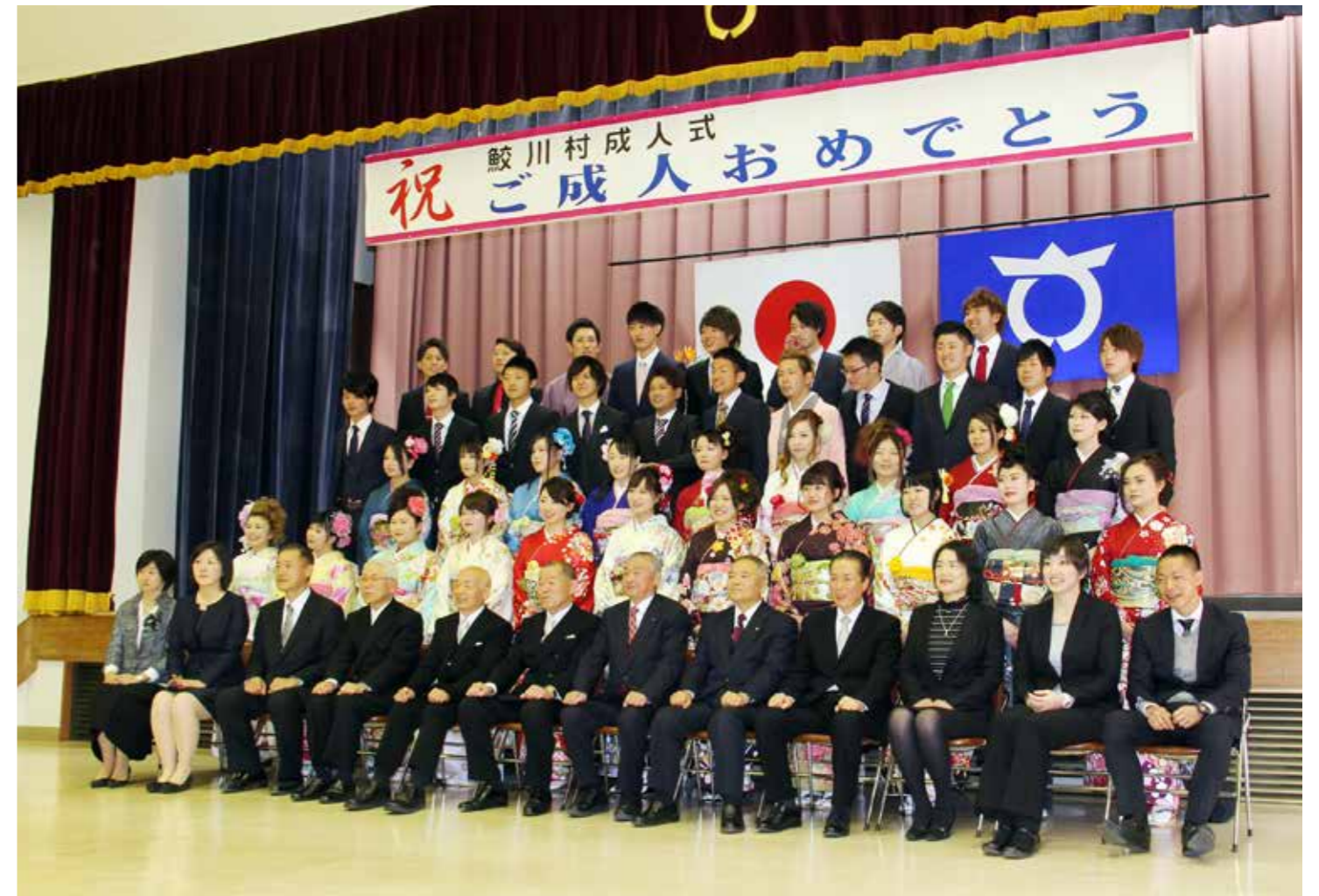
式終了後、出席者全員で記念撮影。人生の節目に新しい思い出が加わった