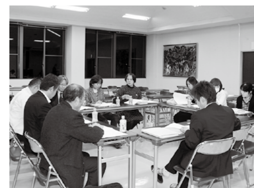
4回にわたって議論を重ねた村総合戦略検討委員会