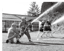
放水訓練を行う消防団員

今回の受賞は、村民の皆さんや関係機関の協力によるものです。ありがとうございました。これからも皆さんに必要とされる広報紙を目指します。