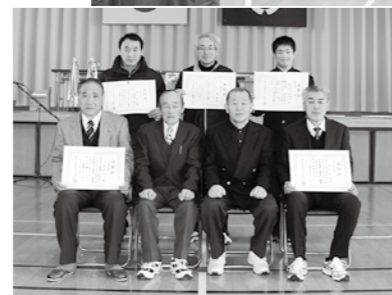
上 熱戦が繰り広げられたインディアカ大会／下 表彰を受けたスポーツ功労賞受賞者