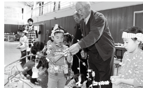
丁寧に餅を飾り付ける園児

小正月行事の「だんごさし」は1月14日、こどもセンターで行われました。子どもたちは、東石老人クラブのメンバーが臼と杵でついた餅を口いっぱい頬張ったあと、実際に餅つきを体験。続いて、願い事をしながらミズキの枝に餅をさし、小正月行事を楽しみました。