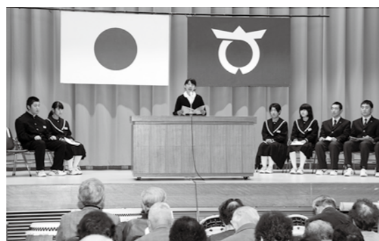
堂々と発表する児童・生徒

「第20回少年主張大会・第14回音楽発表会」は11月3日、村公民館で行われました。主張大会では、小・中・高校生が家族や友人のこと、これまでの経験から感じたことなどを発表。続いて行われた音楽発表会では、小・中学生が美しいハーモニーを披露し、観客を魅了しました。