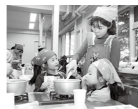
お菓子作りを楽しむ親子

「保護者給食試食会」は11月6日、鮫川小で行われました。「いただきます。ふくしまさん」事業の補助を受けて実施。親子で地場産物をふんだんに使ったメニューを味わい、県産食材に対する理解を深めました。