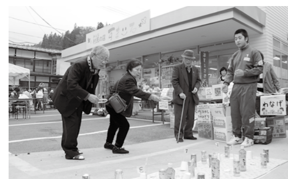
縁日を楽しむ来場者