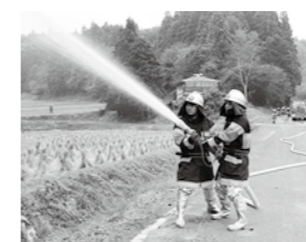
放水訓練を行う消防団員

火災防御訓練は11月8日、官沢地内で行われました。訓練には、棚倉消防署鮫川分署員、村消防団や地元住民が参加。通報から消火までの一連の防御活動が繰り広げられました。団員らは、本番さながらの機敏な動作で、訓練に臨みました。