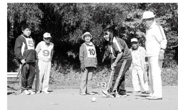
一緒に汗を流す高校生と高齢者

修明高鮫川校生徒会主催の「老人クラブとの親善スポーツ大会」は10月28日、さざり荘ゲートボール場で行われ、高校生と高齢者がゲートボールを通して交流を深めました。大会では、混合チームを編成し、予選リーグ戦、決勝トーナメントで競い合い、和やかな時間を過ごしました。