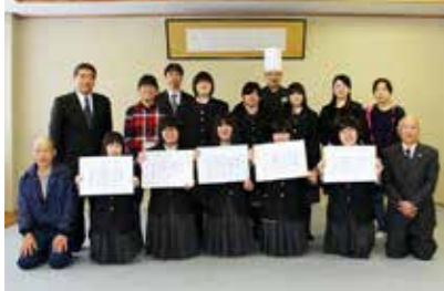
上 最優秀賞(村長賞)に輝いた修明高鮫川校家庭部Bチームの「えごまドレーヌ」 下 表彰状などを手渡された入賞者たち