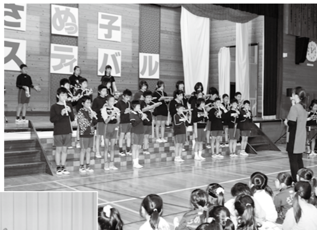
上 息の合った合奏などを披露（「大切なもの」鮫川小5年） 左 感情豊かに表現した劇「プレーメンの音楽隊」（青生野小5・6年）

青生野小では、創作劇、英語劇や全校合唱などが披露されました。プログラムの最後には、児童、保護者、地域住民などが「村民の歌」を合唱し、体育館いっぱいに歌声を響かせました。また、鮫川小では、劇や合奏など、学年ごとに趣向を凝らした演目が発表され、保護者たちから大きな拍手が送られました。