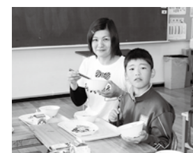
地産地消給食を味わう親子

「保護者給食試食会」は11月6日、鮫川小で行われました。「いただきます。ふくしまさん」事業の補助を受けて実施。親子で地場産物をふんだんに使ったメニューを味わい、県産食材に対する理解を深めました。