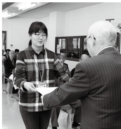
上 アイデア料理コンテストで入賞した「里山洋食シリーズ さめがわクリスマスビーザ」 下 アイデア料理コンテストの表彰式に出席。表彰状と記念品をいただきました