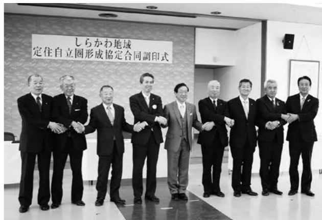
協定を結んだ9市町村長

この協定は中心市宣言を行った白河市と生活圏や経済圏をともしする西郷村、泉崎村、中島村、矢吹町、棚倉町、矢祭町、埴町、鮫川村の8町村が、将来にわたって安心して暮らせる地域をつくるために連携、協力する内容を定めたものです。