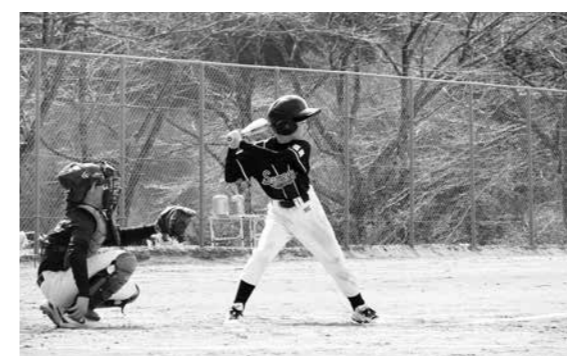
気迫のプレーを見せた選手たち

交流親善大会(鮫川村スポーツ少年団学童野球部主催)は3月28日、村青少年広場で開かれました。大会には、7チーム約100人が出場。5・6年生のAチームはトーナメント戦で、4年生以下のチームは総当たり戦で争われました。熱戦の末、鮫川村チームが優勝しました。