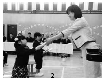
1_担任に名前を呼ばれ元気よく返事をする入学児童(鮫川小) / 2_遠藤校長から新しい教科書を手渡される入学児童(青生野小) / 3_在校生と保護者に拍手で迎えられ、入場する新入生(鮫川中)