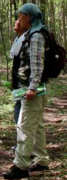
青々とした葉が茂る朝日山登山道