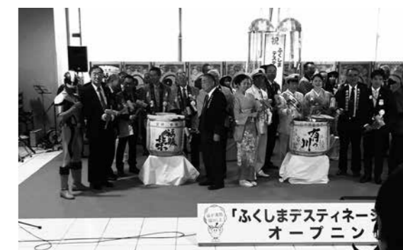
盛大にオープニングを祝う参加者