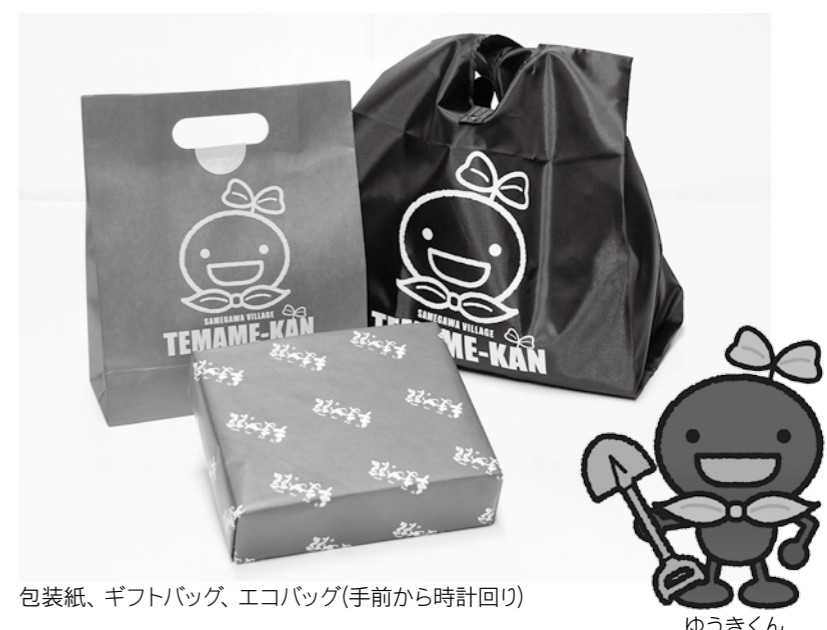
包装紙、ギフトバッグ、エコバッグ(手前から時計回り)

4月は鮫川村の観光地巡りをしました。強滝、江竜田の滝や鹿角平に行きました。特に驚いたのは滝や山にすぐ行けることです。川越市は平野なので山も滝もありません。自然に囲まれた環境で暮らすことは、とても新鮮です。