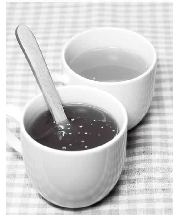
程よい甘さの「抹茶くず湯」(写真手前)と甘さの中にしょうが特有の辛みが特徴の「しょうが湯」。どちらも幅広い年代から好評を得ている

村産のきな粉と米粉を使わず湯としようが湯は、「お湯に溶かすだけで手軽」「体の芯まで温まる」など評判も上々。農閑期の冬場に、