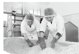
みそ加工を学ぶ学生