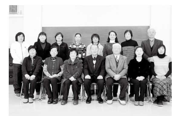
養成講座を修了し、新会員となった皆さん

「26年度食生活改善推進員・健康運動サポーター養成講座」を修了した14人が、新たに会員になりました(左表)。 講座では、▼健診有所見者が生活習慣病を引き起こす危険性▼医療、介護、死亡などの統計から村の実態を把握▼生活習慣病と介護予防につながる食と運動▼健康に害を及ぼす喫煙とアルコール▼歯の健康▼心の健康など、日常の食事や生活習慣が健康と深く関わっていることなどについて学びました。