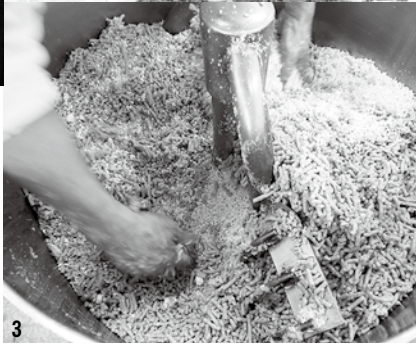
1_切り出した杉をチェーンソーで切断してまきを作りました 2_富田地区夢づくり協議会主催の「梅の木せん定研修会」に参加しました 3_みその加工工程。蒸かした大豆と麴などを混ぜ合わせます 4_凍み大根の作り方を教えてもらいました