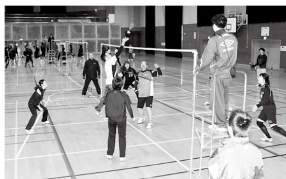
息をのむラリーが繰り返された