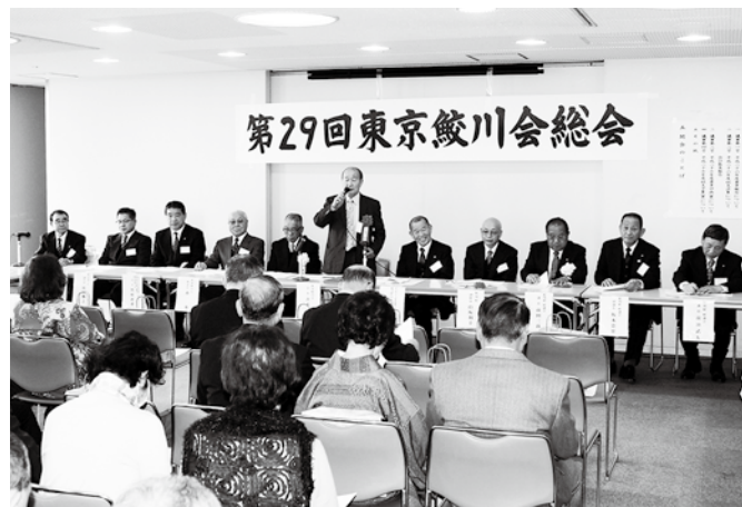
上_多くの会員が出席した総会 左_和やかに行われた新年会

総会終了後は恒例の新年会が行われ、参加者らはふるさと談義に花を咲かせながら、親睦を深めていました。