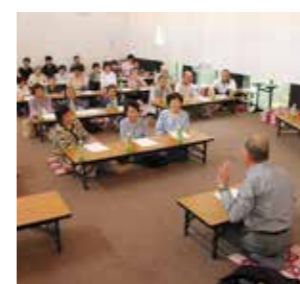
大楽村長の講話を聞く参加者

このほか、村健康運動サポーター「ビーンズヘルスの会」による健康体操や地元食材を使った昼食が振る舞われ、活力をつけました。