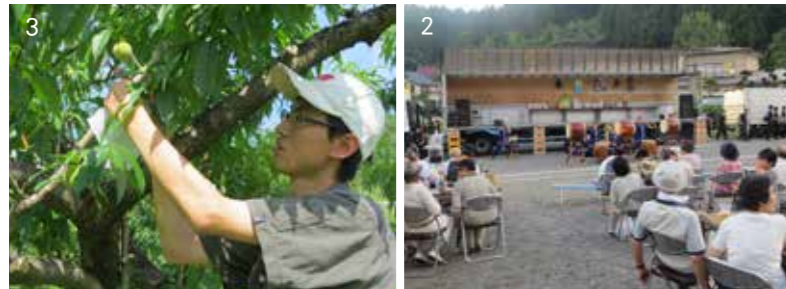
1. 中沢めん羊組合の皆さんとめん羊小屋のたい肥出し作業 2. 多くの催しが行われた「小童まつり」 3. 江籠田で桃の袋がけ作業を体験しました