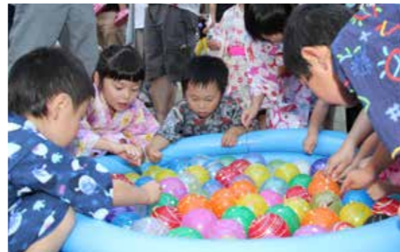
夢中でヨーヨーすくいをする子どもたち

さめがわこどもセンターの夏祭り花火大会は7月25日、同センターで行われました。子どもたちはヨーヨーすくいやポップコーンなどの出店を回った後、キャンプファイヤーを囲んで歌やダンスを楽しみました。最後には花火が打ち上げられ、歓声があがりました。