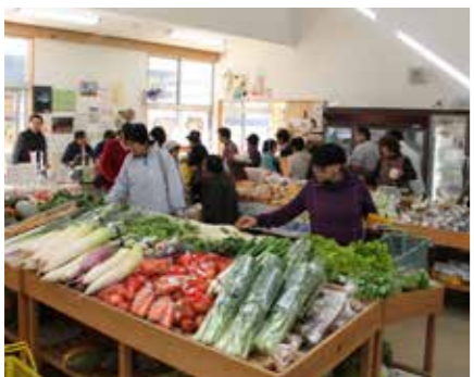
村農産物加工・直売所「手・まめ・館」