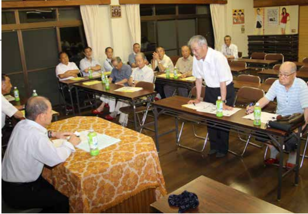
今後10年間の村づくりを考えた行政区懇談会（赤坂東野・石井草区）