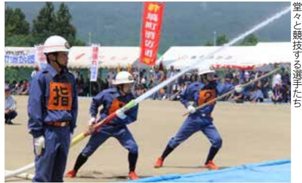
堂々と競技する選手たち

操法技術などを競い合う「第39回福島県消防操法東白川支部大会」は7月27日、矢祭町営グラウンドで開催されました。村からは第1分団が出演。選手たちは厳しい暑さと緊張感の中、練習の成果を十分に発揮し機敏な操法を披露しました。