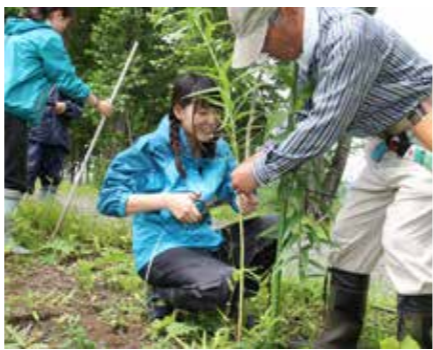
館山公園の管理作業