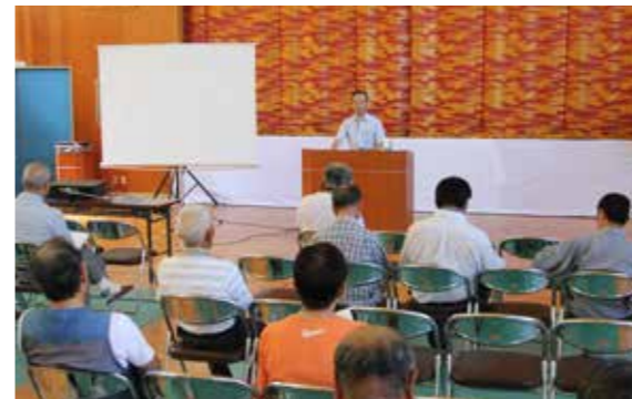
講演を聞く参加者

県指定有形文化財「木造金剛力士立像」の修復に伴い、7月25日、旧富田小体育館で記念式典が行われ、関係者や地元住民が参加しました。式典では、村の歴史を振り返るとともに文化財保護の重要性などを学んだほか、修復工程が説明されました。