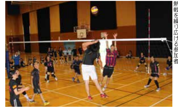
熱戦を繰り広げる参加者

村バレーボール協会が主催する「第11回村バレーボール交流親善大会」は8月17日、村農業者トレーニングセンターで行われました。大会には、小学生から一般までの約60人が参加。混合チームを編成し、プレーを通して交流を深めました。