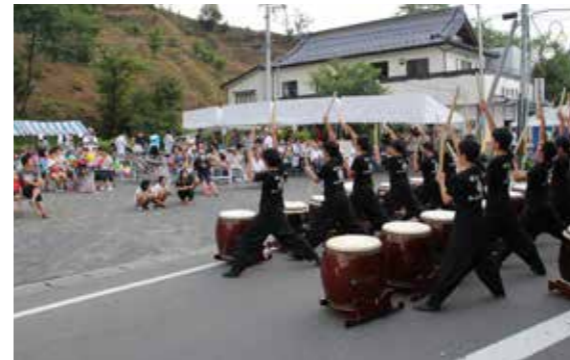
オープニングを飾った和太鼓演奏

小童会主催の「第14回小童まつり」は8月2日、道少田地内で行われました。祭りでは、多くの出店が並んだほか、フラダンスやよさこい踊り、音楽コンサートなど多彩な催しが繰り広げられ、家族連れなどが楽しいひとときを過ごしました。