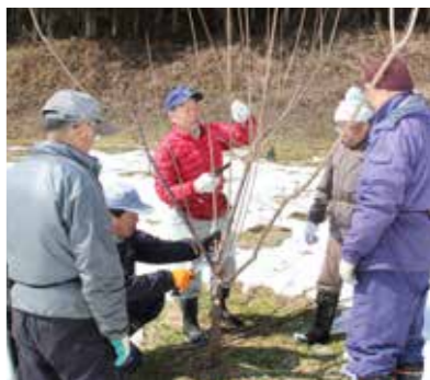
梅の木剪定研修会(富田梅千本の里観光梅園)