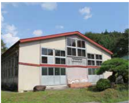
旧渡瀬小学校体育館