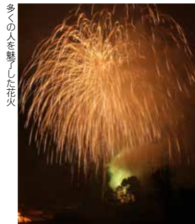
多くの人を魅了した花火

東白川地方体育協会連絡協議会主催の「第26回東白川町村親善球技大会」は8月3日、村内の各会場で行われました。大会には、ソフトボール、バレーボール両競技合わせて23チームが出演。白熱した試合が繰り広げられ、大きな声援が選手に送られました。