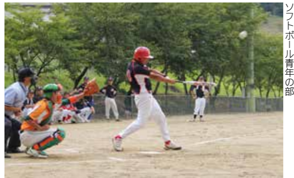
ソフトボール青年の部

東白川地方体育協会連絡協議会主催の「第26回東白川町村親善球技大会」は8月3日、村内の各会場で行われました。大会には、ソフトボール、バレーボール両競技合わせて23チームが出演。白熱した試合が繰り広げられ、大きな声援が選手に送られました。