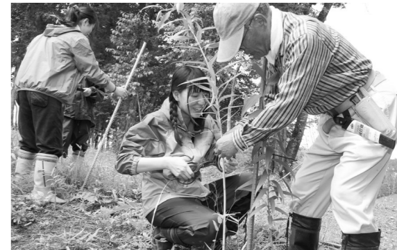
ヤマユリの添え木立てをする参加者

景観保全活動のために来村した東京農業大学の学生と「もりづくり100年委員会」が7月6日、共同で館山公園の管理作業を行いました。同委員会メンバーの指導で、樹木のせん定やヤマユリの添え木立てなどを行い、汗を流しました。