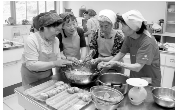
料理作りを体験する参加者

北区健康づくり栄養グループ「食彩」の農村体験ホタルツアーは6月26日から28日までの3日間、村内で行われました。ツアーには約40人が参加。ホタルの幻想的な光を観賞したほか、村の食材を使った料理作りやランプシェード作りなどを体験しました。