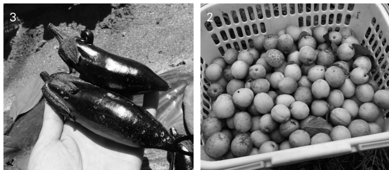
1. 緑川末治さん（内ヶ竜）の所で大豆の土寄せ作業の手伝いをさせていただきました。 2. ウメを収穫しました。今年はウメのなりがいいそうです。 3. 借りている畑でナスが実りました。