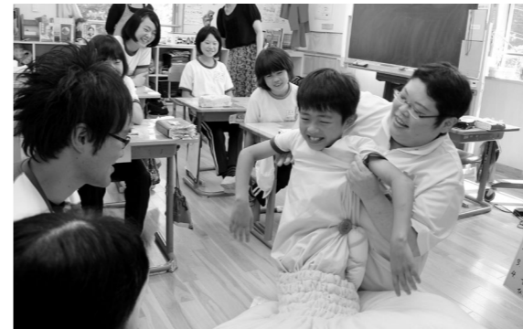
胎児を疑似体験した児童

「いのちの授業」は7月16日、青生野小5・6年生を対象に実施しました。児童は出産までの過程を学んだほか、胎児を疑似体験しました。また、授業の最後には、児童1人1人に保護者からの手紙が渡され、家族の愛情や命の尊さを実感しました。