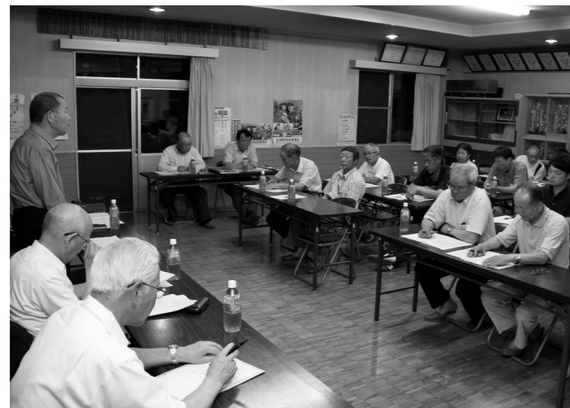
多くの意見が寄せられた行政区懇談会(富田区の様子)

今後、皆さんからいただいた貴重な意見や提言を踏まえた上で、応募があった村民の皆さんで構成する「第4次鮫川村振興計画策定むらづくり委