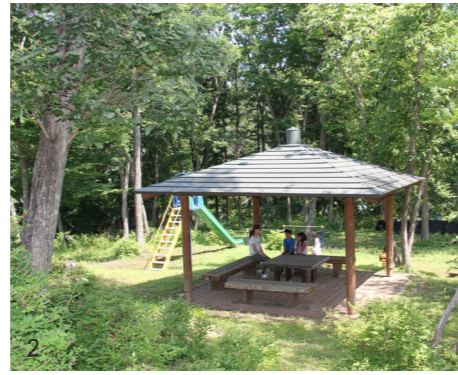
1. ヤマユリが咲き誇る園路を頂上目指して歩いていきます。 2. 館山中腹の東屋で一休み 3. 歩みを止めてヤマユリを観察

このように、四季折々の花木を觀賞したり学習や健康づくりの場として利用したりと、楽しみ方はさまざまです。皆さんも自分に合った楽しみ方を見つけてはいかがでしょうか。