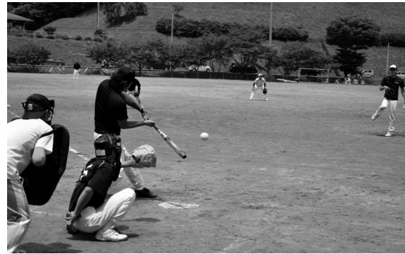
ソフトボール青年の部（青少年広場）

村体育協会主催の「第69回健康づくり夏季球技大会」はバレーボールが6月29日、ソフトボールが7月6日、村内各会場で行われ、熱戦が繰り広げられました。各部の上位2チームは8月3日に本村で開催される東白川町村親善球技大会に出場します。