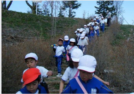
鮫川小1・2年生の館山探検

鮫川小学校では、館山公園を利用して縦割り班での遠足や森林環境学習、生活科の体験学習などを実施。子どもたちが自然とふれあい、地域を知る機会となっています。また、館山公園内に記念植樹エリアを設け、これまでに多くの鮫川・青生野小学校、鮫川中学校の卒業児童・生徒が卒業記念植樹を行ってきました。