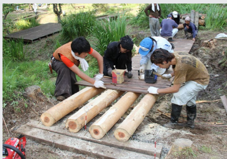
ピオトープ内に橋を設置する学生

大学生の実習の場として活用されています。毎年、東京農業大学短期大学部環境緑地学科の「緑地工学実習」が行われています。実習では、生き物観察などができるピオトープの整備や散策のための階段やウッドデッキの設置などを行っています。学生たちに学習の場を提供するとともに、館山公園の景観整備が行われています。