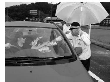
安全運転を呼びかけたテント村

交通安全協会鮫川支部と村交通対策協議会では、夏の交通事故防止県民総ぐるみ運動期間中の7月18日、宿ノ入交差点と中野町交差点付近で「交通安全テント村」を行いました。鮫川駐在所で出動式を行ったあと、ドライバーにチラシなどを配り、安全運転を呼びかけました。