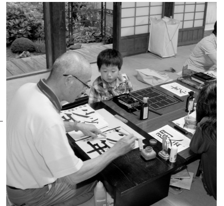
和気あいあいとした雰囲気と程良い緊張感の中で行われている書道教室