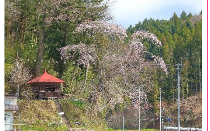
③ 長遠寺のしだれ桜