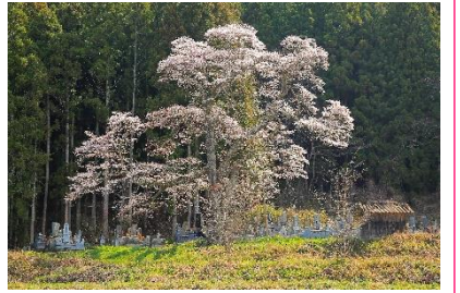
② 官沢の地藏様のしだれ桜