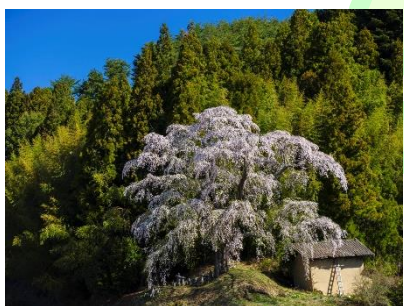
⑤ 江竜田のひがん桜