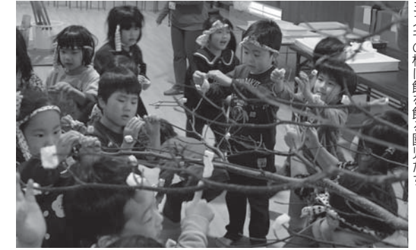
ミノキの枝に餅を飾る園児たち

こどもセンターで1月15日、小正月行事の団子さしが行われました。子どもたちは臼ときねで餅つきをしたあと、小さく切り分けた餅を丁寧に木の枝に飾り付けました。また、ついた餅はネギ餅などにして食べ、無病息災を願いました。