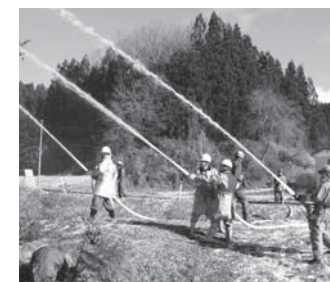
放水訓練を行う消防団員

文化財防火デー火災防衛訓練は一月十九日、赤坂中野字取上地内「東堂山・阿弥陀如来像堂」付近で行われました。 訓練には、棚倉消防署鮫川分署員や村消防団員など関係者約五十人が参加。放水訓練が行われ、消防団員らは真剣な表情で訓練に臨んでいました。