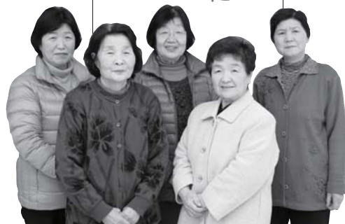
今回、大豆料理を教えていただいた食生活改善推進員「ひまわりの会」の皆さん

健康に良い大豆をさらに気軽に食べるために簡単に作れる大豆料理を、食生活改善推進員さんに教えていただきました。