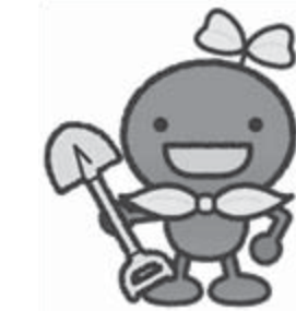
ゆうきくん 豊かな土づくりセンター「ゆうきの郷土」のイメージキャラクター。有機たい肥「ゆうきくん」を通して、鮫川村の良さを全国にアピールするために頑張ります。

昨年9月に完成した良質な有機たい肥「ゆうきくん」を村内全戸に無償配布します。安全にこだわり丹精込めて作り出したので、安心してご使用ください。なお、すべてのたい肥は放射性物質検査を行い、国が定める基準値400ベクレルを厳格化し村独自の基準値を200ベクレルと定め、それ以下であることを確認して出荷しています。 配布数量 1戸当たり小袋たい肥(40L)2袋 配布方法 配布する引換券を村農産物加工・直売所「手・まめ・館」または村豊かな土づくりセンター「ゆうきの郷土」に持参し、たい肥と交換してください。なお、「手・まめ・館」においては、お手数でも各自で積み込みを行ってください。 ※障がい者や高齢者のみの世帯については、配達も可能ですので役場農林課または「ゆうきの郷土」にお問い合わせください。