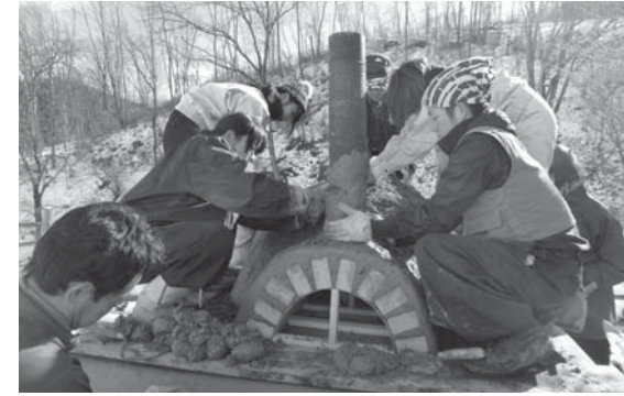
粘土で窯を形作る学生たち

東京農業大学の第84回里山景観保全活動は12月20日から22日までの3日間、村内で行われました。今回の活動には、学生26人が参加。「手・まめ・館」の敷地内にピザ作り体験などができる石窯を製作しました。石窯は3月に完成する予定です。