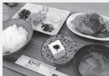
「達者の豆腐」や味噌豆、豆腐入りハンバーグなど、大豆加工品がふんだんに使われた日替わりランチ

また、喫茶店「手まめCafe」では、きなこクリームパンやきなこクッキーなどが販売されています。このように、村特産の大豆を生かした商品が数多くあります。