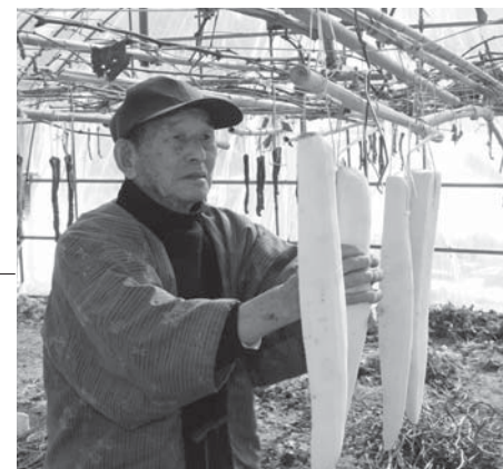
きれいに皮をむくこともポイント。皮が残っていると均等にしみないといひます。