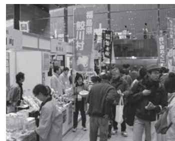
多くの来場者でにぎわった会場

農協、商工会、村で構成する「ふる里振興協議会」が参加。村特産品を販売したほか、飲食スペースでは、「味噌カレーうどん」を提供するなど、鮫川村の魅力をアピールしました。