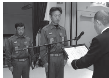
上…通常点検を受ける幹部団員 左…無火災分団と優良団員の表彰が行われた出初め式