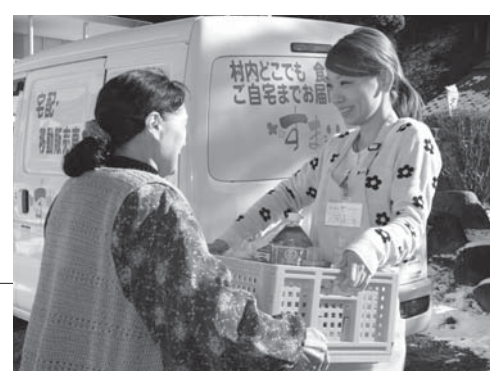
注文いただいた商品を自宅までお届けします

買い物弱者支援や地域活性化などを目的とした村民の店「すまいる」では、十二月十七日から宅配・移動販売を開始しました。利用方法 配布されたチラシなどを見て、必要な商品を選択し、前日までに電話またはファックスで注文します。※運行日および時間については、右表のとおり 料金 配達は無料です。また、商品については、代金と引き換えになります。 配達可能商品 弁当や食料品、日用品など店舗で扱っている商品全般 問 村民の店「すまいる」 ☎ 569001 / FAX 5769002