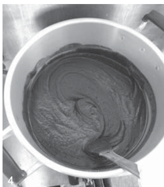
3. 脱粒された大豆。今年はいい大豆が多いという話を聞きました。 4. 関根のぶ子さんに餡子の作り方を教えてもらいました。