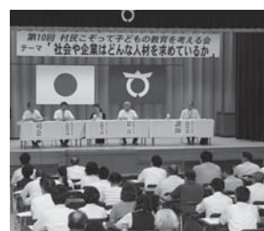
さまざまな意見が交わされた考える会