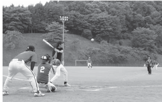
ソフトボール青年の部（青少年広場）

村体育協会主催の「第68回健康づくり夏季球技大会」は6月30日、村内各会場で行われ、熱戦が繰り広げられました。大会には、各地区から22チームが参加し、バレーボールとソフトボールで上位入賞を目指しました。