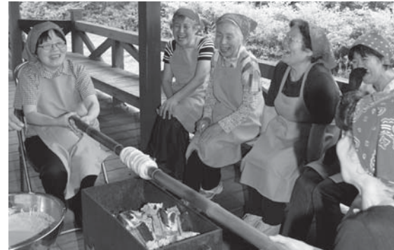
バウムクーヘン作りを楽しむ参加者

北区健康づくり栄養グループ「食彩」の農村体験ホタルツアーは6月29日から7月1日の3日間、村内で行われました。ツアーには30人が参加し、村の保存食を使った郷土料理作りやバウムクーヘン作りを体験したほか、ホタルの幻想的な光を鑑賞しました。