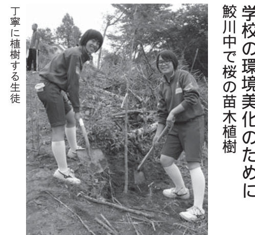
丁寧に植樹する生徒

北区健康づくり栄養グループ「食彩」の農村体験ホタルツアーは6月29日から7月1日の3日間、村内で行われました。ツアーには30人が参加し、村の保存食を使った郷土料理作りやバウムクーヘン作りを体験したほか、ホタルの幻想的な光を鑑賞しました。