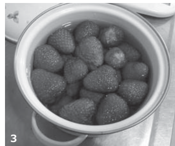
2. 鮫川小の子どもたちと「田んぼの生き物調査」。いろいろな生き物を見つけました。 3. 自家製のイチゴシロップ。とてもおいしくできました。これからいろいろなものを作りたいです。