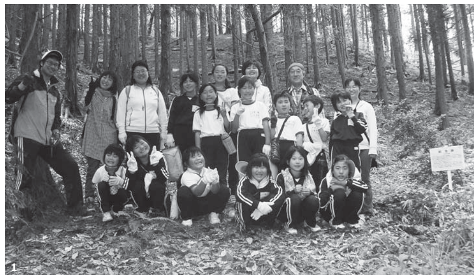
1. 青生野小の皆さんと一緒に「鮫池跡」で記念撮影。鮫川村の名前の由来や植物について学ぶことができました。