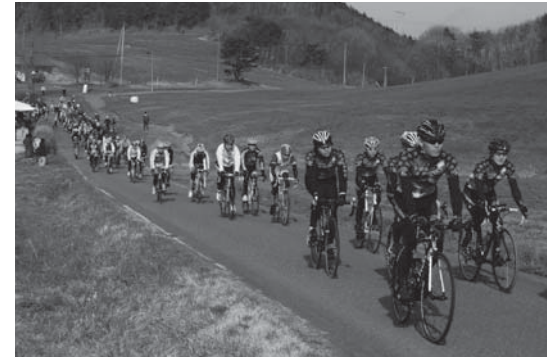
大自然の中を駆けぬける選手たち

LinkTOHOKU 主催、村共催の「鮫川村ロードレース大会」は4月14日、鹿角平観光牧場をメイン会場に開催されました。大会には、県内外から約120人が参加。牧場周辺の特設コースでの個人やチームでのタイムトライアルレースで走力を競いました。