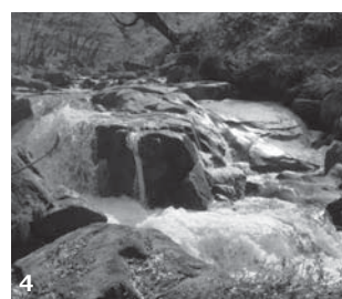
3・4. 村内の景勝地を回り、鮫川村の魅力を感じています(3. 天狗橋のカタクリ/4. 強滝)

でいるいろいろな活動をしているのでよろしくお願ひします。私が鮫川村に来ての第一印象は「寒い」です。特に私が鮫川村にやってきた四月十一日は前日に雪が降ったこともあり、夜も寒さでなかなか寝付けないほどでした。今は追加していただいた毛布と持参した湯たんぽをフル活用して夜はぐっすり眠れています。でも、桜の花がほころんでくるほど暖かくなってきたのでもう少ししたら湯たんぽなしでも寝られるようになるかもしれません。鮫川村に来てもう一つ思ったことは車の運転速度が速いです。超がつく運転初心者でペーパ