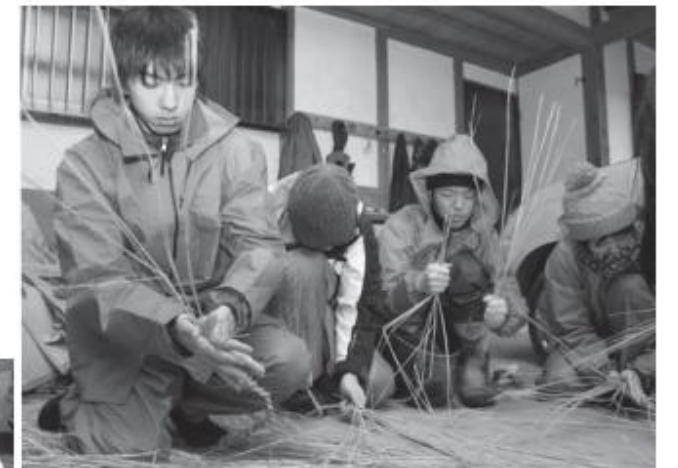
上…「縄もじり」を体験する学生 左…棒を使った大豆の脱粒作業