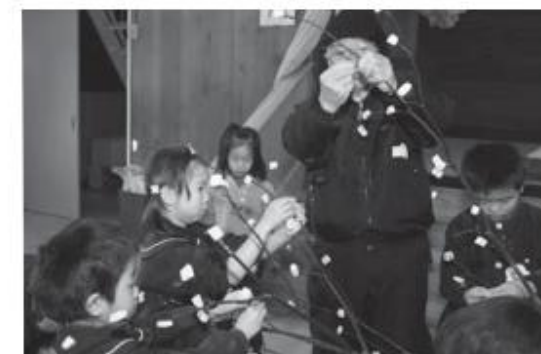
「だんごさし」を体験する子どもたち