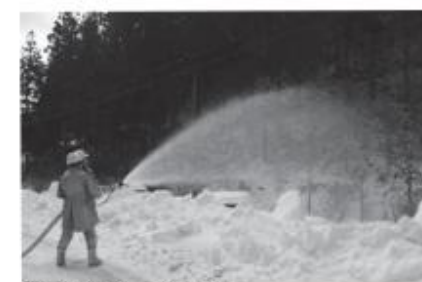
放水訓練を行う消防団員

「文化財を守れ!」火災防衛訓練を実施 文化財防火デー火災防衛訓練は一月二十日、西山字戸倉地内「阿夫利神社」付近で行われました。 棚倉消防署鯉川分署員や村消防団員など関係者約五十人が参加。訓練では、防災無線運用や放水訓練が繰り広げられ、消防団員らは万が一に備えて真剣な表情で訓練に励んでいました。