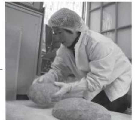
つき上がった餅を手際よく成形していきます