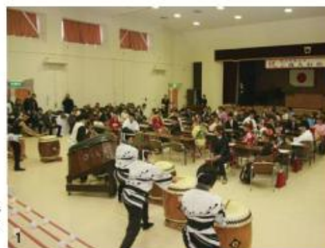
1 成人を祝う太鼓が披露された／2 久しぶりに再会した友人と記念撮影