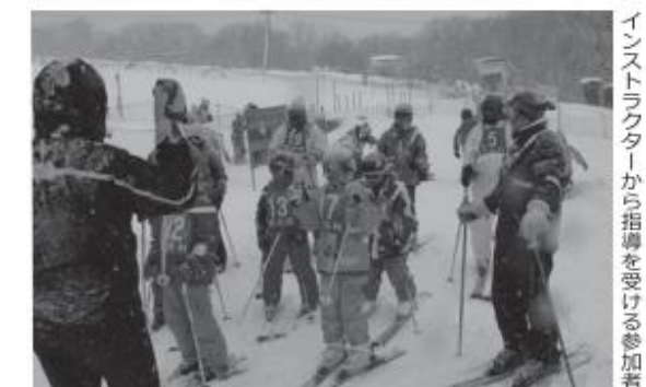
インストラクターから指導を受ける参加者

村公民館事業のチャレンジスクール第7回講座「スキー教室」は1月27日、猪苗代町の猪苗代スキー場で開かれ、親子23人が参加しました。