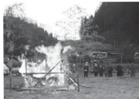
上…真坂地区の「とり小屋」 左…落合地区の「どんと焼き」

落合地区では1月20日に「どんと焼き」を開催。子どもたちに伝統行事を知ってもらおうと催され、大勢の住民が参加しました。また、子どもたちも役員として参加。正月飾りなどを供養したあと、甘酒やすいとんを食べながら伝統行事を楽しみました。