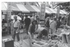
たくさんの人でにぎわった「北区区民まつり」

東京都北区の「ふるさと北区区民まつり」が十月六日、七日の二日間、「王子銀座商店街・秋の味覚まつり」が十月十四日に東京都北区の各会場で開かれました。村ふる里振興協議会が同イベントに参加。村内産の農産物や加工品などを販売し、鮫川村の魅力アピールしました。王子銀座商店街とは平成八年にコンサルタント会社の紹介により交流が始まり、平成十八年には、そのつながりから「ふるさと北区区民まつり」に参加するようになりました。今後も、都市と山村の立地条件の違いを生かして交流を進めていきます。