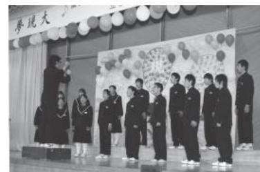
練習の成果が披露された合唱

鮫川中学校の学校祭「壇の岡祭」は10月20日、「夢現大」をテーマに同校で行われました。意見文発表や英語弁論発表、学年ごとに総合学習で学んだことを披露。また、学級対抗の合唱コンクールが行われ、生徒たちの工夫が集結した学校祭となりました。