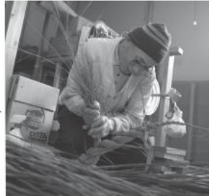
素早い手付きで正月用のしめ縄を作っていきます