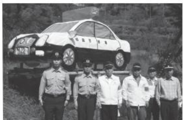
設置されたパトカー型灯籠

埴二区灯籠愛好会から柵倉警察署に寄贈されたパトカー型灯籠が9月26日、村農産物加工・直売所「手・まめ・館」北側に設置されました。夜間は点灯し、赤色灯が回転。同所を通過するドライバーに、安全運転を呼びかけています。