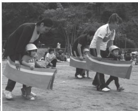
上…さかなだ！さかなだ！（たんぼほ親子競技） 左…くりとくらのえんそく（4歳児団体競技）