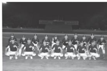
熱戦を繰り広げた選手たち

第6回市町村対抗福島県軟式野球大会に出場した鮫川村チームは初戦を突破し、10月13日に行われた2回戦に挑み、富岡町と対戦。5回表に1点を先制しますが、その裏に3点を挙げられ逆転。結果2対3で惜しくも敗れましたが、粘り強いプレーを見せました。