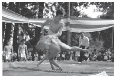
迫力ある取組を披露

赤坂西野区の恒例行事「ふるさと相撲大会」は10月7日、名下地内の熊野神社境内で開かれ、迫力ある取組が繰り広げられました。大会には地元青年会や東京農大の学生など18人の力士が参加。ちらし相撲や飛び三人抜き、弓取りなどが披露されました。