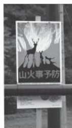
林野火災防止用標識

財団法人日本防火・危機管理促進協会から配布された林野火災防止用標識が村内約60カ所に設置されました。 村では、昭和62年4月に200ヘクタールを焼失した大規模な山林火災が発生しました。この大火から25年が経過していますが、大火の記憶を忘れることなく林野火災予防を心がけましょう。