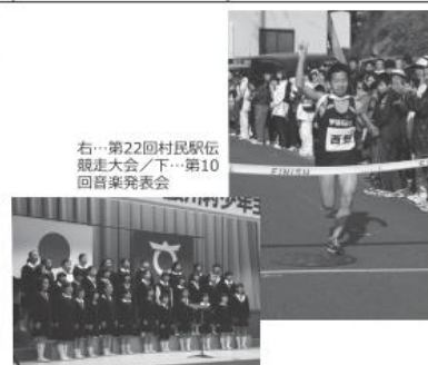
右…第22回村民駅伝競走大会(下)…第10回音楽発表会