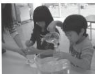
実験をする子どもたち