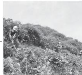
シルバー人材センターの草刈りボランティア(8月10日)