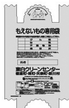
図1 もえないもの専用袋（青文字）

▼変更点 ①現在とは異なる指定袋を利用して分別している、びん類、缶類、不燃物類、焼却灰を「もえないもの専用袋（図1）」の一種類で分別する必要があります。②現在の「ペットボトル専用袋」の名称を「資源物専用袋（図2）」に変更します。「発砲スチロール（トレイ）製品」「プラスチック製容器包装製品」「紙製容器包装製品」は「資源物専用袋」を利用して分別してください。