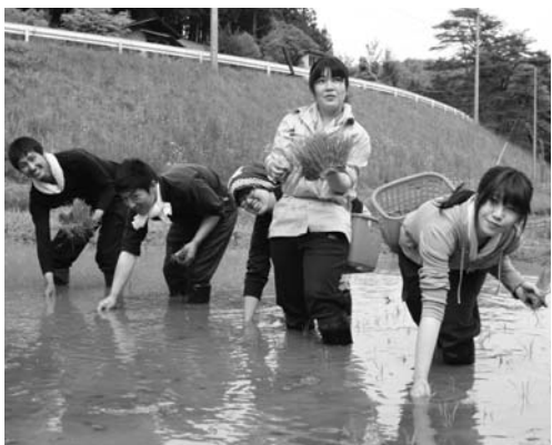
田植えを体験する学生たち

東京農科大学の第七十五回景観保全活動は、五月二十六日、二十七日の二日間、村内で行われました。