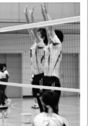
対石川中 0対3 惜敗 対五箇中 2対3 惜敗 【ソフトテニス】(団体戦) 対棚倉中 1対2 惜敗

各顧問の先生方からも「本当に皆最後までよく戦ってくれました。この経験が次の大会に生きるものだと思います」「鮫中生のマナーも大変良かった。」とお褒めの言葉をいただきました。ご支援、ご声援ありがとうございました。