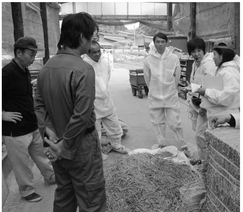
澤口農場で説明を受ける視察団

国際協力機構（JICA）の視察研修「環境に配慮した草地畜産開発」は六月七日、村内で行われ、六方国七人の参加者が地域資源を有効活用する「村ハイオマスヴィレッジ構想」などについて学びました。 一行は、鮫川村豊かな土づくりセンターで同構想について説明を受けたあと、施設内を視察