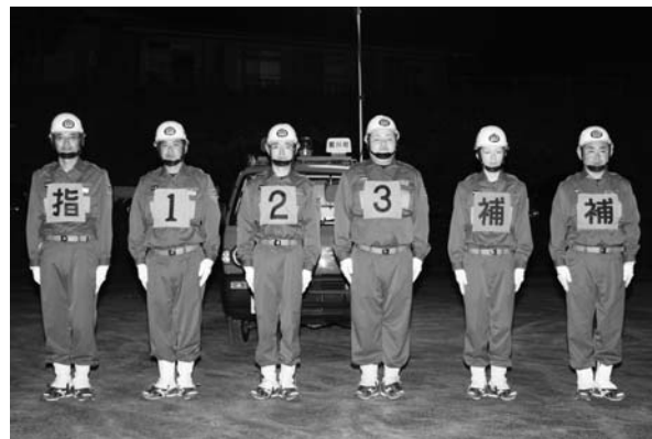
小型動力ポンプの部に出場する第3分団