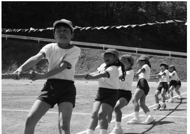
青生野小の綱引き

村内二つの小学校の春季大運動会は五月に開催され、子どもたちの元気な声が響きわたりました。 鮫川小は五月十九日、青生野小は同二十七日に開催。両日も、天候に恵まれ、子どもたちは短距離走や綱引きなどおなじみの種目のほか、趣向を凝らしたさまざまな種目で競い合いました。 子どもたちは、家族らの大きな声援を受けながら、元気にいっぱい校庭を駆け回っていました。