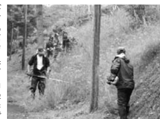
(文・写真 鮫川中学校)

六月九日(土)、第一回PTA親子奉仕作業が行われました。全方部保護者の皆様と子どもたちが中心となり、早朝五時三十分から作業を行いました。