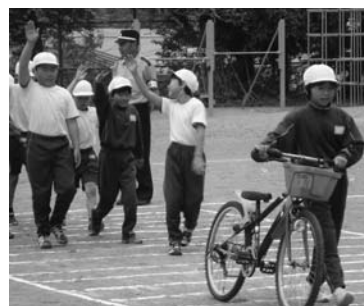
鯨川小学校の交通教室

夏休みは、自転車に乗って遊びに行く子どもたちも多いと思いますが、乗る前にきちんと点検しましょう。つま先が地面につくか、ライトはつくか、チェーンはたるんでいないか、タイヤの空気は十分に入っているかなどを確認してください。また、福島県では自転車に乗る際にヘルメットをかぶるよう呼びかけていますが、鯨川村でもかぶっていません。子どもが多く見受けられます。万が一、交通事故にあったときに、ヘルメットをかぶっていたことで命が助かるということがありますので、