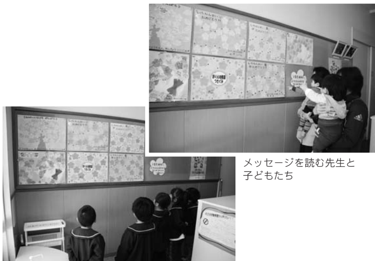
メッセージを読む先生と子どもたち