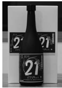
純米吟醸酒「鮫川21」…アルコール度数18度以上19度未満/内容量720ml/瓶入りで税込み1,250円