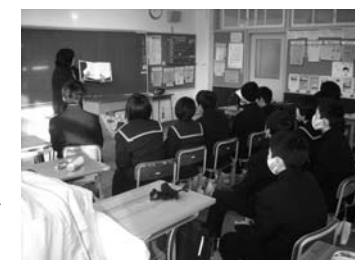
(文・写真) 鮫川中学校

学校支援地域本部事業の一環 読み聞かせを行いました 地域のお話ポケットの方々による絵本の読み聞かせを、朝の十五分間を活用して一月〜三月までに六回、各教室に向向いていただきました。