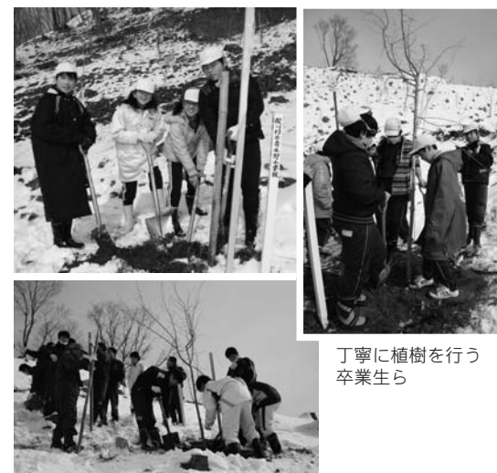
丁寧に植樹を行う卒業生ら