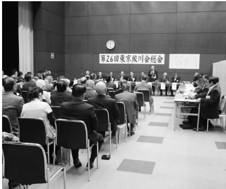
大勢の会員が出席した総会

第二十六回東京鮫川会総会は、一月二十八日、東京都の新宿住友ビルで行われました。会員・村関係者など約八十人が出席。総会では、平成二十三年度事業報告および収支決算承認、平成二十四年度事業計画および収支予算について審議されたほか、任期満了による役員改選が行われました。