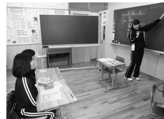
いのちの大切さを伝える学習

「家庭問題」の順となつていきます。(図1) また、具体的な内容を見ると、自らの命を絶つた人の多くは何らかの心の病気を抱えていたことがわかっていきます。(図2) 自殺の原因や動機となつた問題を含め、過度のストレスが心