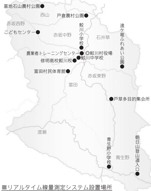
リアルタイム線量測定システム設置場所

東 京電力福島第一原子力発電所の事故を受けて、文部科学省により、県内の学校や公園などにリアルタイム線量測定システム(上写真)が二七〇〇台設置され、村内にも十二地点(右図)で測定しています。 このほど、装置周辺の空間線量のリアルタイム測定結果が文部科学省ホームページで公開されています。村ホームページ上の「空間線量測定結果を公開しています」からご覧ください。 問い合わせ 村総務課総務係 ☎ 49-3111