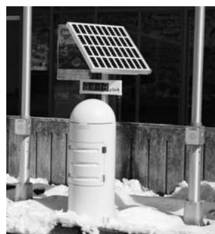
村内12地点に設置された リアルタイム線量測定システム