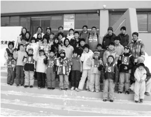
スキー教室に参加したスクール生

村公民館事業のチャレンジスクール第七講座「スキー教室」は一月二十八日、二十九日の二日間、北塩原村のグランデコスノーリゾートで開かれ、親子約四十人が参加しました。同スクールは、小中学生とその保護者を対象に年九回行われているもので、七回目となる今回はスキー教室を開催。クラスを分けて指導が行われ、参加者は思い思いにスキーを楽しんでいました。