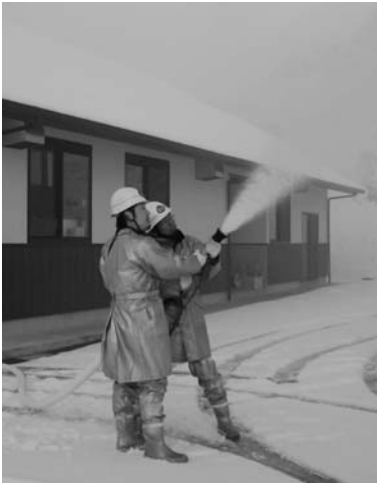
訓練を行う消防団員ら

火災防御訓練は二月二十六日、赤坂中野字巡ヶ作地内(「手・まめ・館」付近)で行われました。訓練は、全国春季火災予防運動の一環として実施。「たばこの投げ捨てにより枯草に着火、山林に延焼拡大し、「手・まめ・館」に火勢が迫ってきた」との想定で、棚倉消防署鮫川分署と村消防団による訓練が繰り広げられました。訓練終了後には、消火器の取り扱い訓練が行われ、「手・まめ・館」職員や住民が真剣に訓練に臨んでいました。