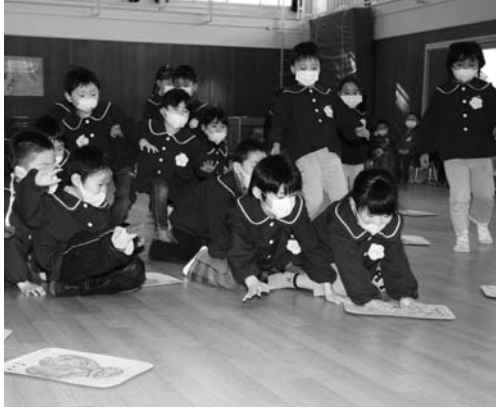
お正月ゲームを楽しむ子どもたち

さめがわこどもセンターの「お正月ゲーム大会」は一月二十四日に行われ、園児が「お正月ゲーム」を楽しみました。はじめに、全員でわらべうた「おしよがつはええもんだ」を合唱。続いて、コマ回しや大判かるたとり、すごろくみかんとりを実施。大判かるたとりでは、読み札が読み上げられると子どもたちは、一斉に目当てのかるたまで走り、元気にかるたとりを楽しんでいました。