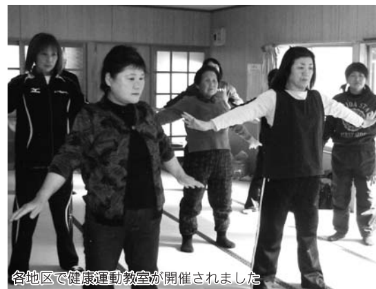
各地区で健康運動教室が開催されました

日頃の運動不足と生活習慣病の予防を目的とした「健康体操教室」が昨年11月から今年1月にかけて、村内7地区で開かれ、約130人が参加しました。