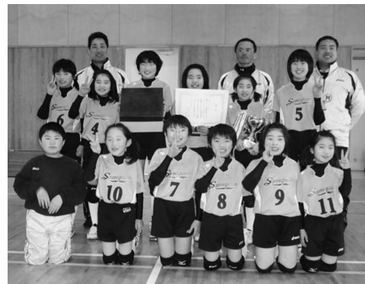
優勝を喜ぶ部員ら

同バレーボール部はこのほか、昨年十二月に行われた「東西しらかわ大会」、一月の「中島あやめ杯」に出場し、いずれも優勝を収めています。 このほか、昨年十二月に行われた「東西しらかわ大会」、一月の「中島あやめ杯」に出場し、いずれも優勝を収めています。