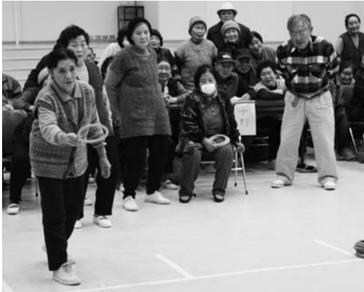
得点を競い合ったクロリティー大会

村老人クラブ連合会主催の第三回村長杯争奪クロリティー大会は一月二十七日、村公民館で行われ、東石1チームが見事優勝しました。大会には、村内の老人クラブから二十七チームが参加。予選リーグを勝ち抜いた九チームが決勝トーナメントで熱戦を繰り広げました。成績は次のとおり。 ①東石1チーム②中野6チーム③西野1チーム