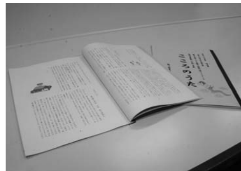
発刊された「こころのうた」

子どもたちの「こころ」が集まってできた作品集です。公共施設などに置いてありますので、どうぞご覧ください。