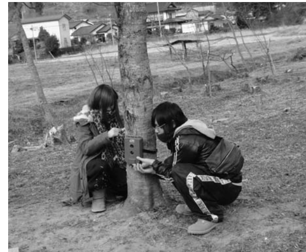
館山公園内のピオトープ付近にセンサーカメラを設置する学生