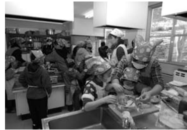
親子で調理を楽しむ参加者。

また、1月15日にも行われ、「トマトライス」「コンソメスープ」「ヨーグルトサラダ」「クレープ」の4品を親子で楽しく調理しました。