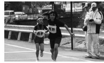
村民駅伝競走大会