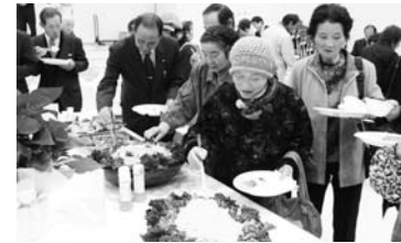
鮫川の郷土料理を楽しむ会