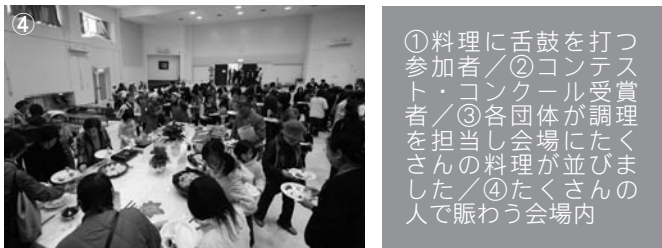
① 入賞者表彰式の様子 ② アイディア料理コンテストの入賞作品 ③ アイディア料理コンテストの調理風景 ④ 郷土料理を楽しむ会の様子