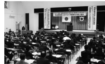
村内で農学会が開催された