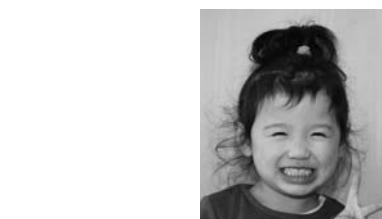
受診児四人中三人でした（写真）。次回の三歳児健診は、二月二十一日（火）の予定です。