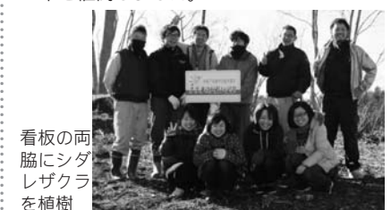
看板の両脇にシダレザクラを植樹

話 題 ●館山公園に記念植樹 平成7年度鮫川中学校卒業生が12月24日、三十三の厄払記念として役員が館山公園にシダレザクラ2本を植樹しました。