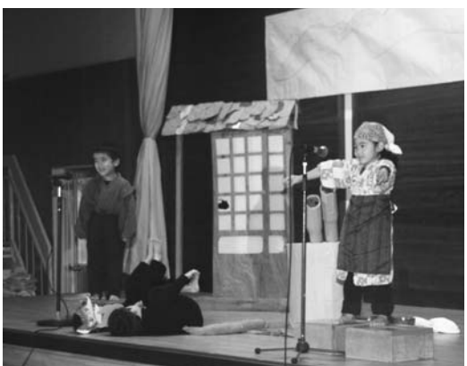
練習した成果を発表する園児

さめがわこどもセンターで十二月三日、お遊戯会が開かれました。発表は、三歳児以上の園児九十人が元気に披露。「かちかち山」「ずかごばけ」「ちいさなたまねぎさん」「ももたろう」などの劇のほか、幼稚園児によるうたや合奏、得意技などが次々と披露されました。子どもたちは、練習した成果を保護者の前で元気に発表しました。