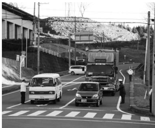
事故防止を呼びかける関係者

交通安全協会鮫川支部と村交通安全対策協議会主催の「交通安全テント村」は、年末年始の交通事故防止県民総ぐるみ運動前日の十二月九日、赤坂中野字宿ノ入地内の交差点で繰り広げられました。テント村には交通関係者約三十人が参加。鮫川駐在所で出発式を行ったあと、通行するドライバーにチラシやティッシュを配り、年末年始の安全運転を呼びかけました。