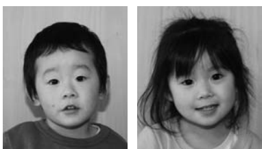
むし歯がなかったお子さんは、十一月二十九日に村保健センターで実施した三歳児健診で、むし歯がなかったお子さんは、