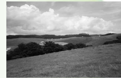
鹿角平観光牧場 (大字渡瀬字青生野地内)

あつーい夏がやってきました。 暑さでバテ気味の方が多いかもかもしれませんが、 そんなときは、冷房器具もいいですが、 マイナスイオンたっぷりの天然クーラーで 涼しい気分を味わってはいかがでしょう。