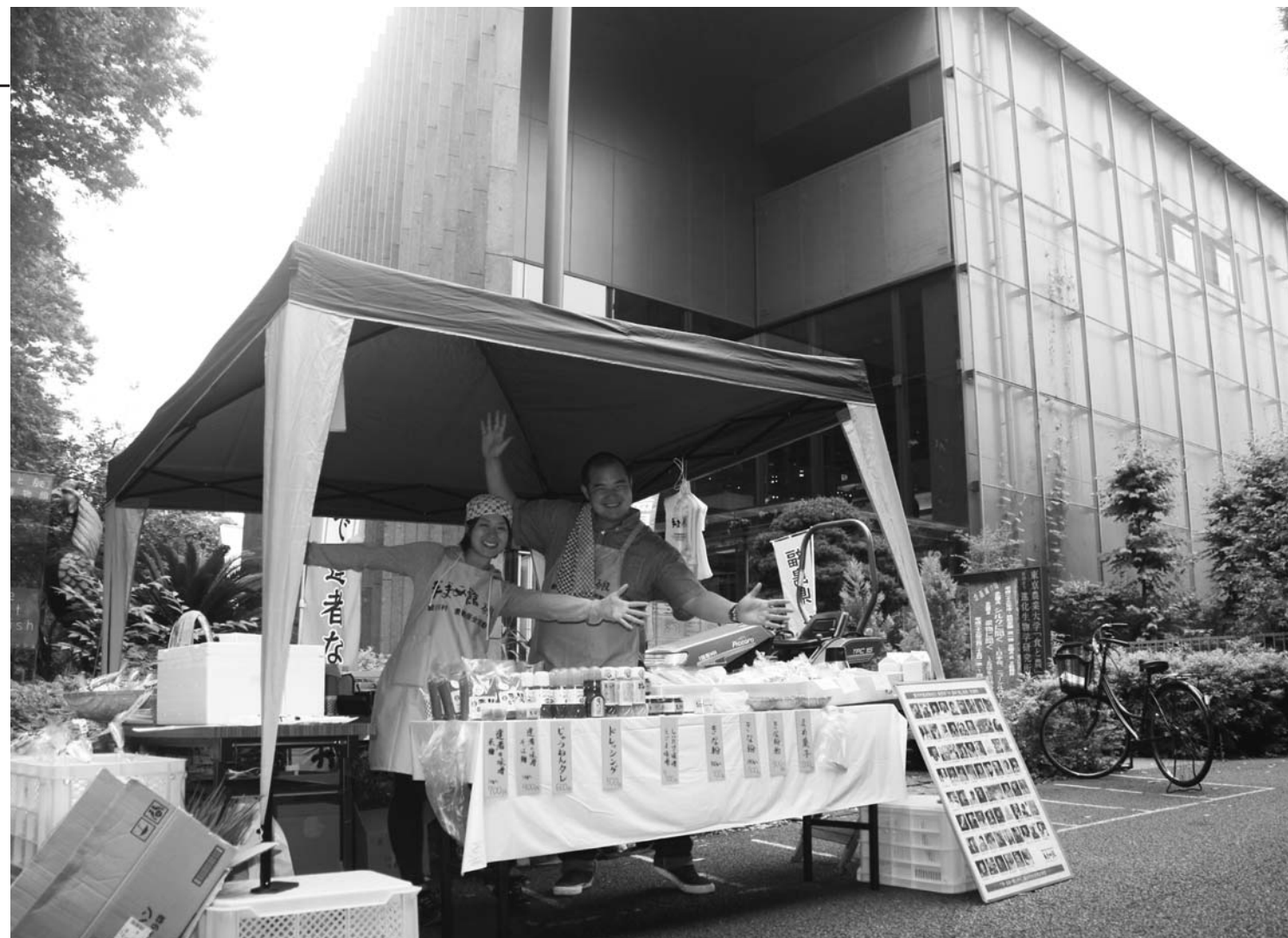
東京農業大学「食と農の博物館」で物産販売

販売会は、5月と6月に開催され、これまで村へ景観保全活動に訪れた学生たちにお手伝いいただき、博物館を訪れる人やリピーターなどで賑わいました。今後も月1回程度開催して、村の安心安全な農産物をPRしていきます。