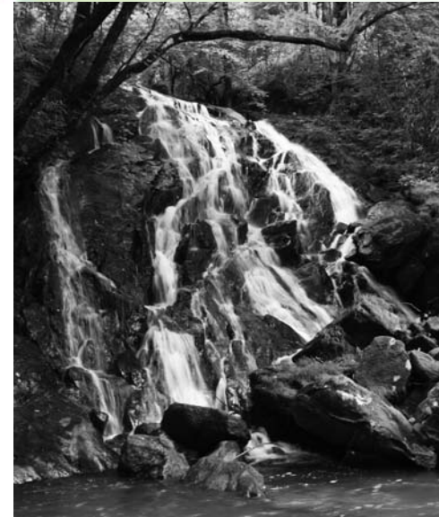
江竜田の滝 (大字渡瀬字前ノ沢地内)