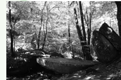
天狗橋 (大字赤坂東野字蕨ノ草地内)