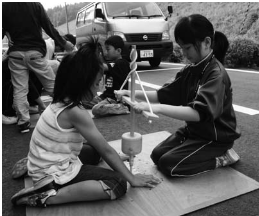
火おこしをチャレンジする子どもたち

村公民館事業「チャレンジスクール」の開講式は六月十一日、村農業者トレーニングセンターで行われました。