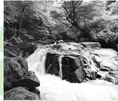
強滝 (大字西山字強滝地内)