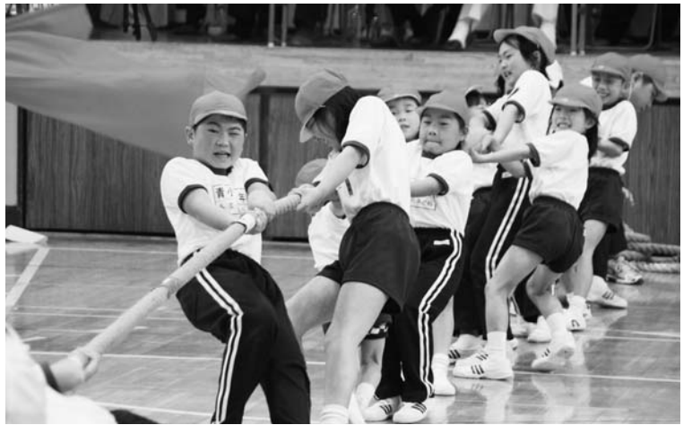
青生野小の綱引き

村内二つの小学校の春季大運動会は五月に開催され、子どもたちの元気な声が響きわたりました。