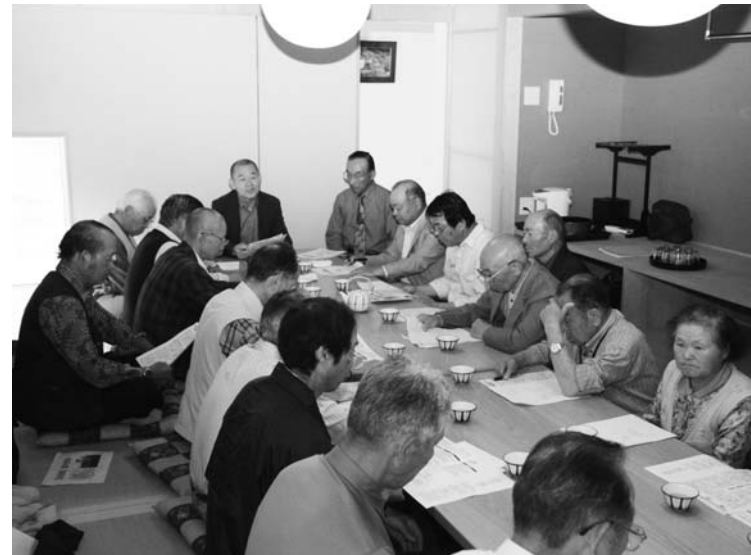
大楽村長の講話を熱心に聞き入る組長ら