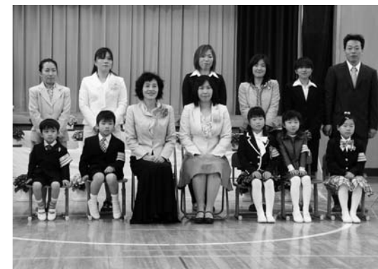
式終了後に記念撮影

昨年十月に耐震改築・改修工事が竣工し、今回の大震災では全く被害がでなかったことに、子どもたちばかりでなく、地域の皆さん、先生方もとても安堵しています。悲しいニュースばかりでしたが