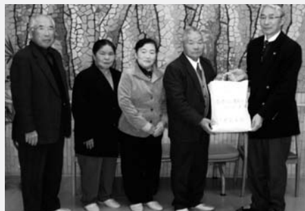
タオルを手渡す中野長生会のみなさん

※お誕生・おくやみ・寄附欄への掲載を希望されない方は、届け出の際に申し出てください。