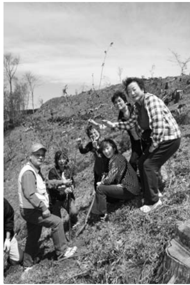
館山公園に記念植樹

初日は、鹿角平観光牧場でバーベキューを行った後、朝日山登山や長井農園（青生野地区）で山菜採り、そば打ち体験などを楽しみ、新緑のふるさとを満喫しました。 二日目は、富田薬師堂や越惣太郎就縛の地を訪れ、村の歴史を探訪しました。また、将来、館山公園が花いっぱいになることを願い、オオヤマザクラなどの記念植樹を行いました。