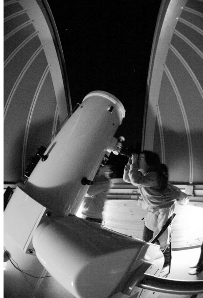
鹿角平観光牧場では、和太鼓ライブ、夜には天体観望会が行われ、バーベキューを楽しむ人たちや元気に遊ぶ子どもたちで賑わいました。