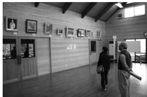
ほっとはうす・さめがわでは、アクリル画作品展を開催。アクリル画愛好会会員が描いた見事な作品に見入っていました。