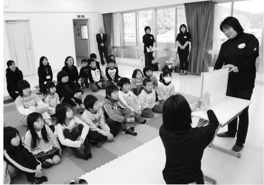
本の読み聞かせグループおはなしポケットによる読み聞かせ

四月二十三日の「子ども読書の日」にちなんだ村教育委員会主催の「図書館へ行こう」は四月二十五日、村図書館で開催されました。