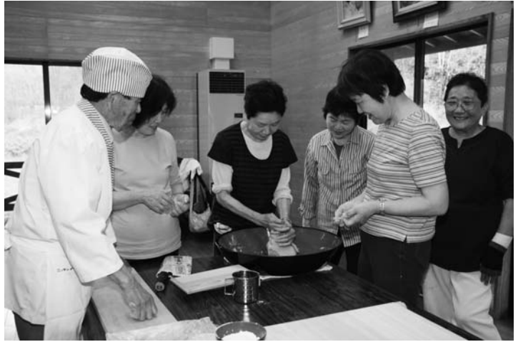
そば打ちを体験する参加者